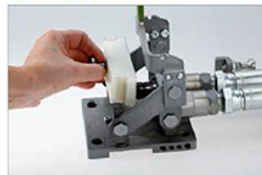
Schutzplatte in das System einsetzen