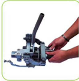
Einsetzen der Werkzeugplatte in die Mechanik.