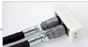
Parkstation mit Wechselplatte