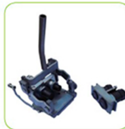
Wechselplatte kann entnommen werden.