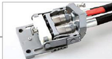
Mechanik mit eingesetzter Schutzplatte