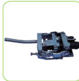
Bei Einrasten des Sicherungsstiftes ist das System verriegelt und betriebsbereit.