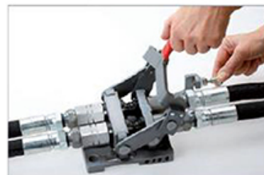
Sicherungsstift ziehen, Schließhebel zum öffnen nach oben ziehen