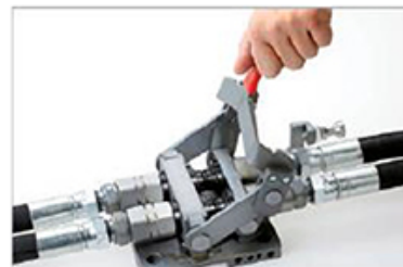
Schließhebel nach unten einrasten lassen