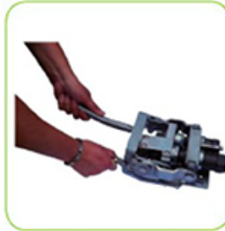
System entriegeln durch Ziehen des Sicherungsstiftes.