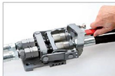
Das System ist geschlossen und das Werkzeug einsatzbereit