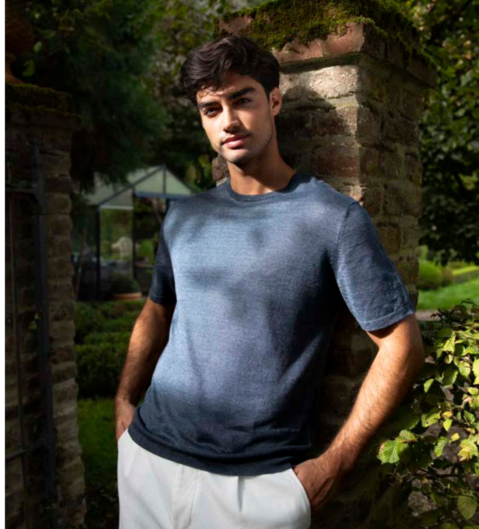
Strickshirt Selino S00169/760