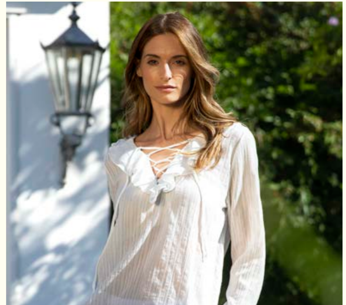
Bluse Ursel-KO 151063/100

Leinen verkörpert die Schlichtheit und Natürlichkeit der Provence. Perfekt für warme Tage, verleiht es jedem Outfit eine lässige Leichtigkeit und ein entspanntes Flair.