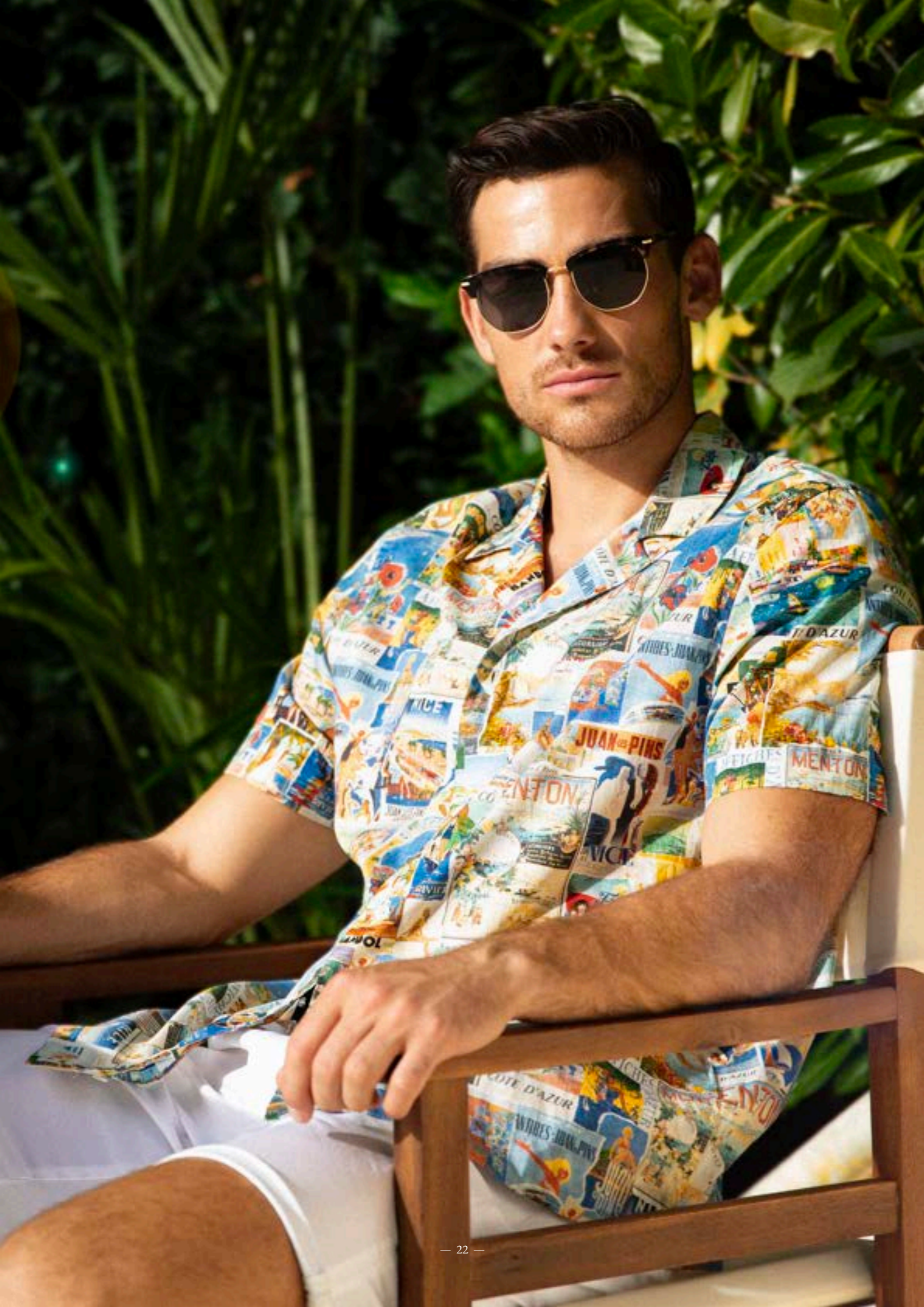
Hemd Rido1-S 170194/743