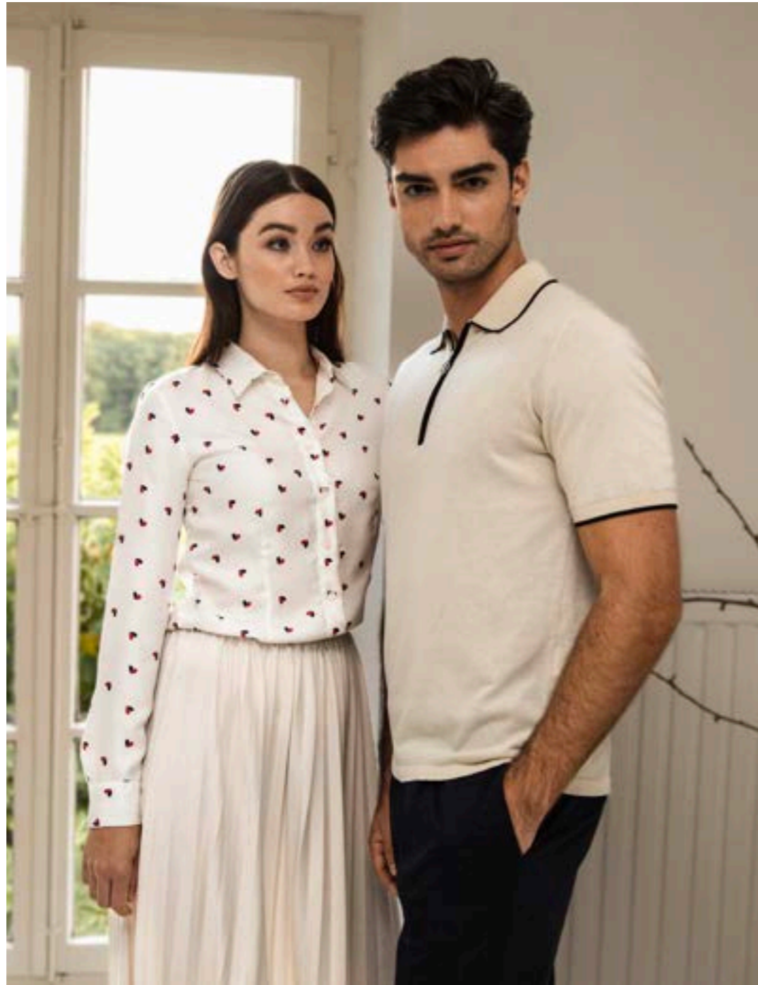
Bluse Muse-FB Z20095/100