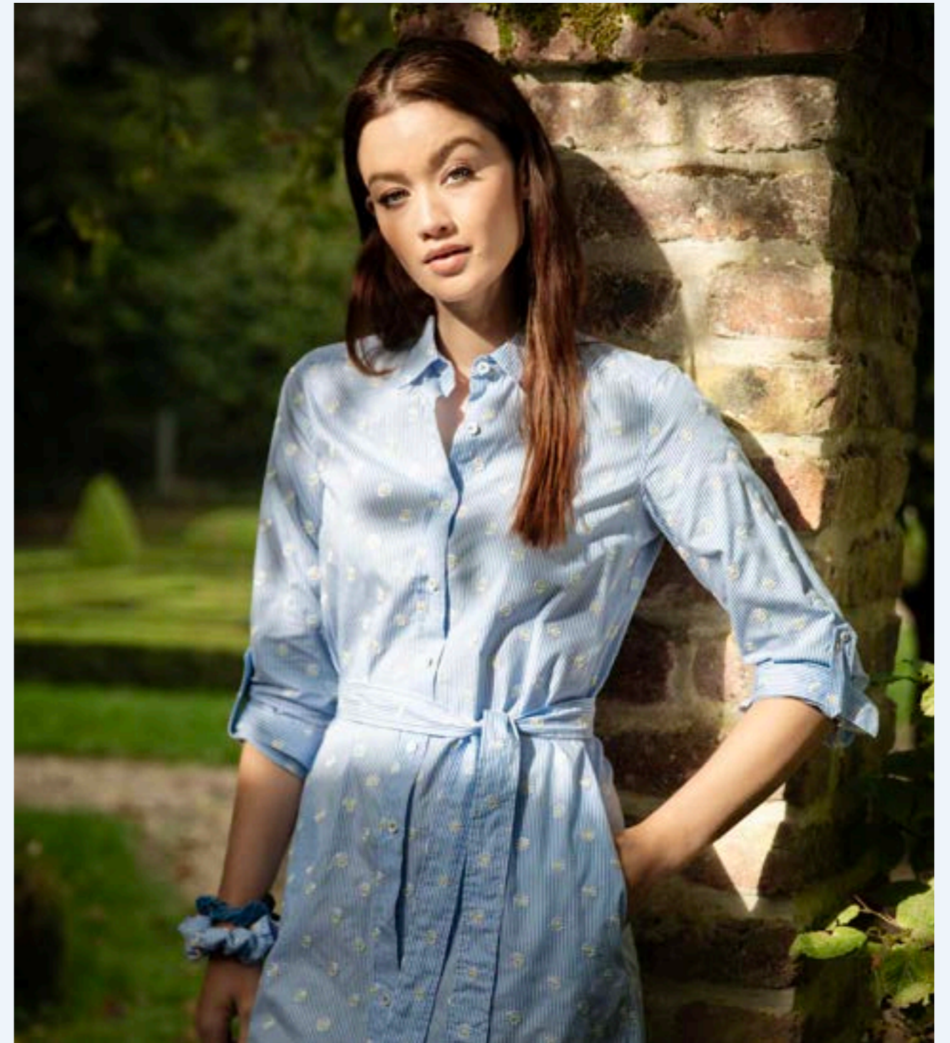
Kleid Keas-F 151316/730