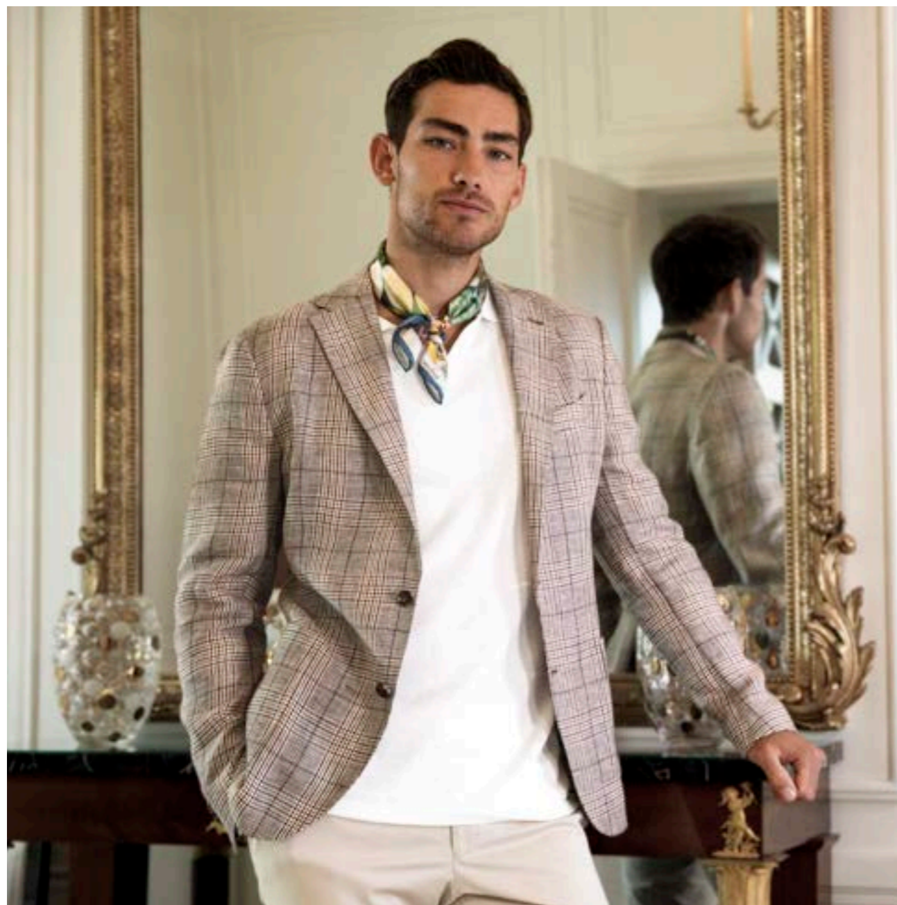
Sakko Farin H01203/150