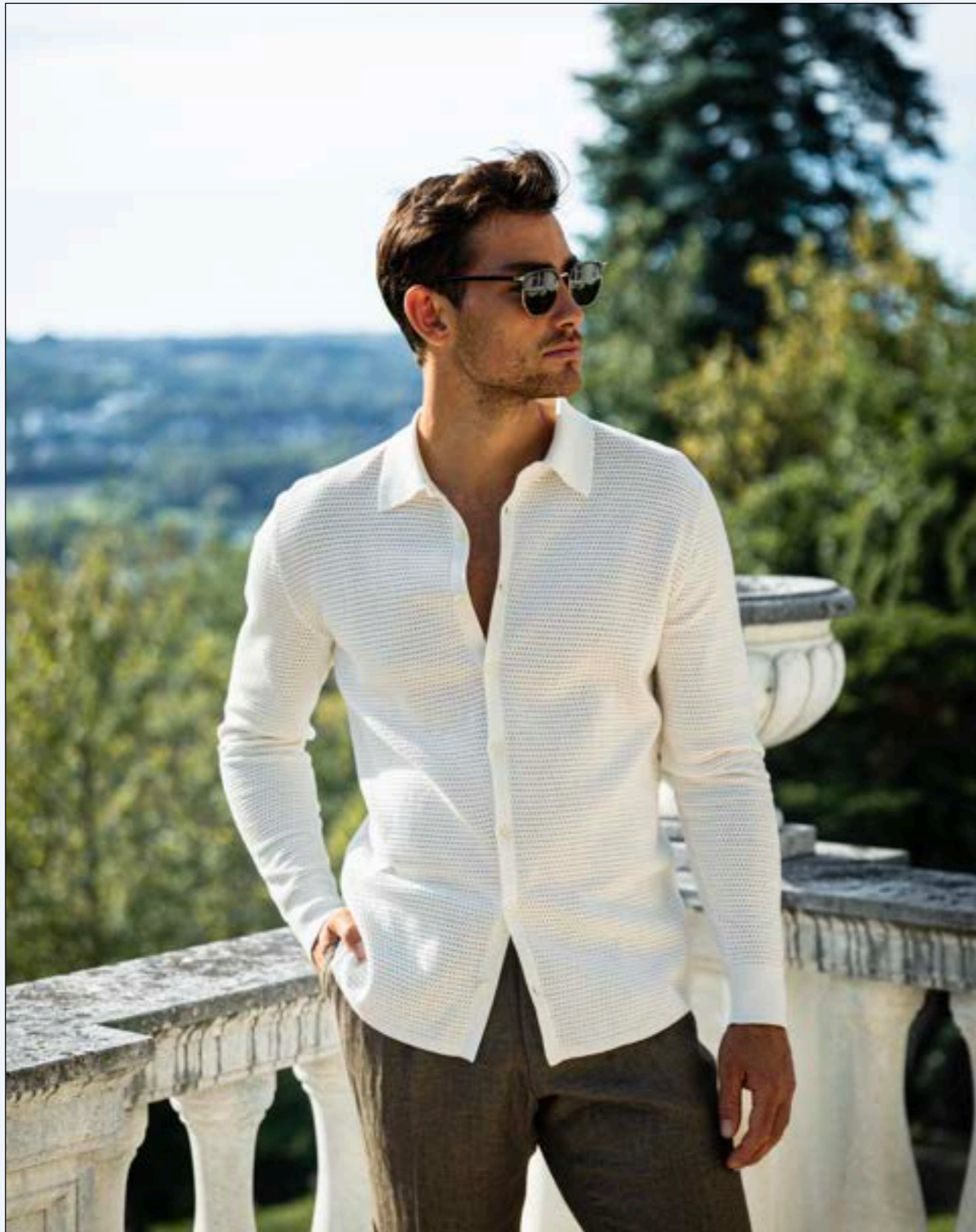
Strickshirt Safino S00267/100

Ein Hauch von Charme und gestrickte Leichtigkeit verleihen jedem Augenblick eine besondere Note – eine subtile Eleganz, die den Alltag in zauberhafte Nuancen hüllt.