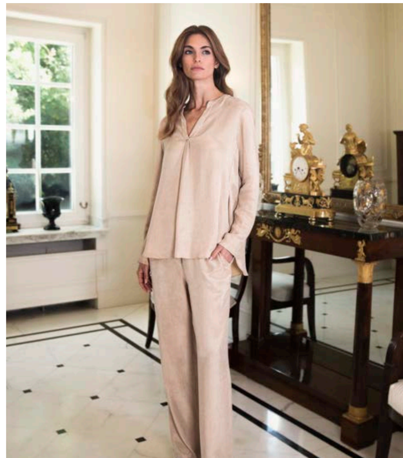
Bluse Ponny 155007/250