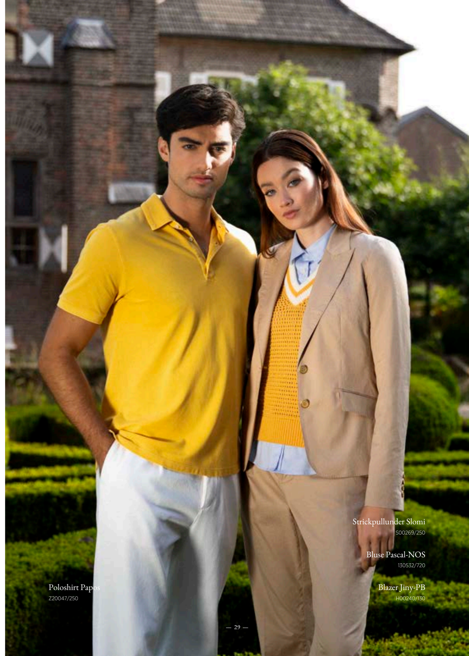
Poloshirt Papos Z20047/250