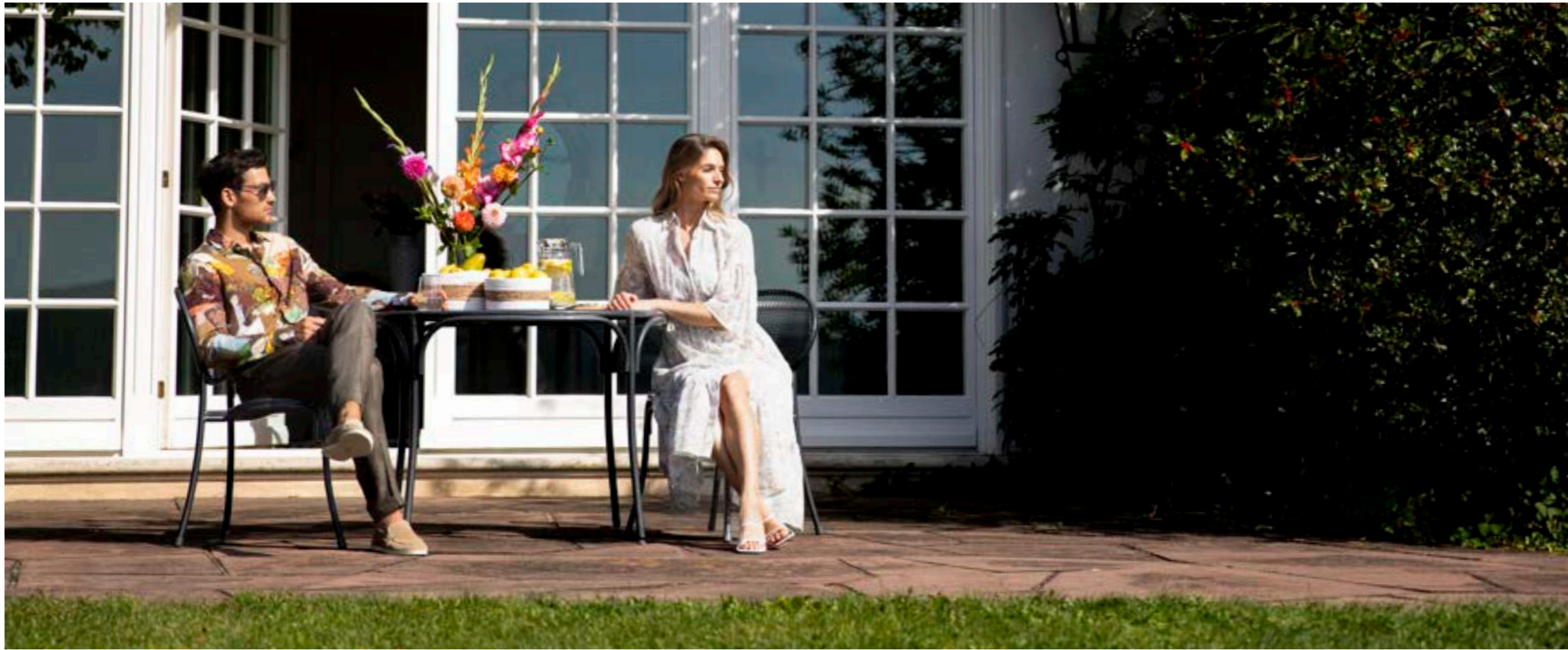
Hemd Ryley1 172044/140