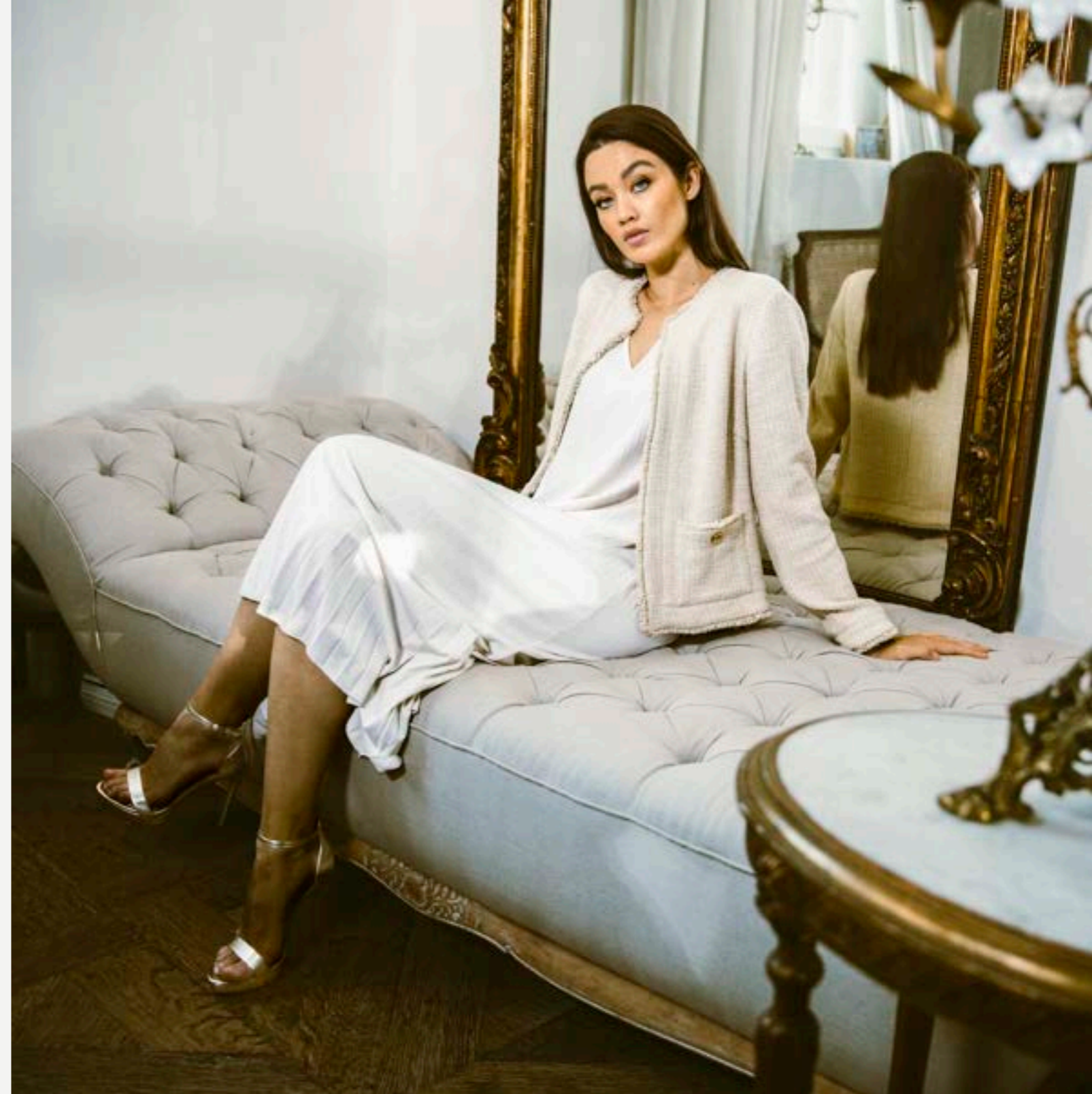
Strickleid Maluna Z20052/100