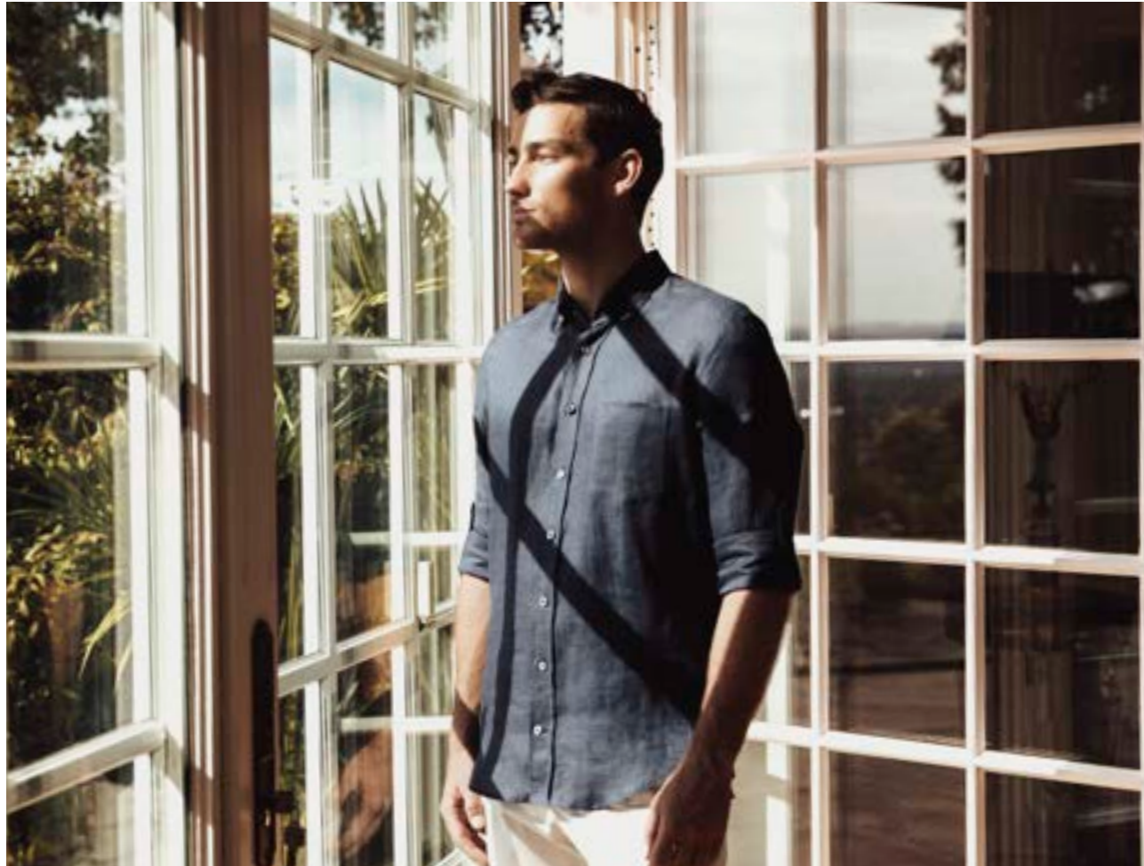
Hemd Ralon-CFK 150555/785

Tauchen Sie ein in die nostalgische Atmosphäre und genießen Sie das sanfte Flüstern der Vergangenheit, eingefangen in jedem Faden unseres Leinens.