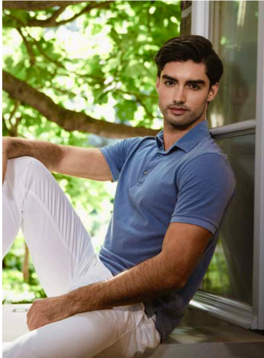
Polo Papos Z20047/760