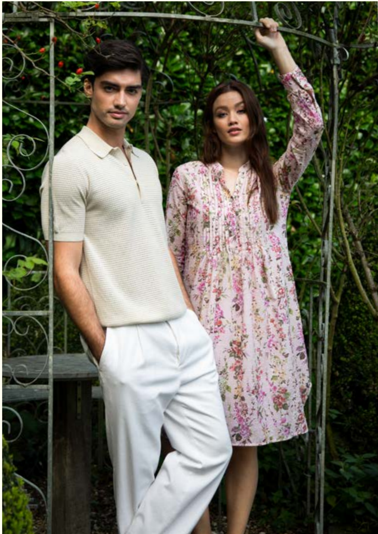
Strickshirt Samero S00267/120