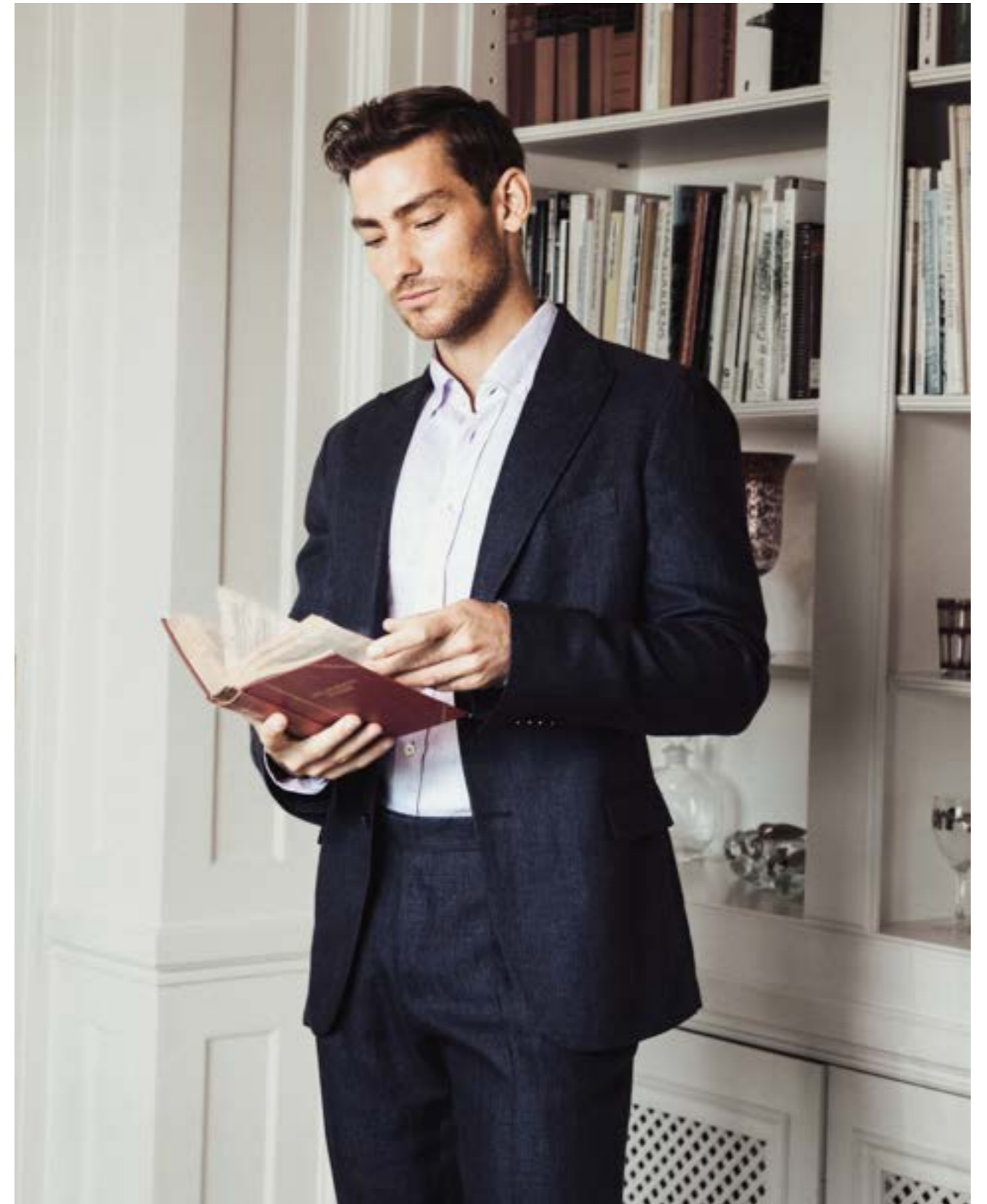
Sakko Fistan H55027/790