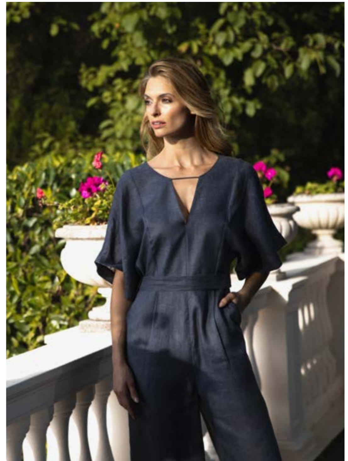
Jumpsuit Hotti-O 150555/785