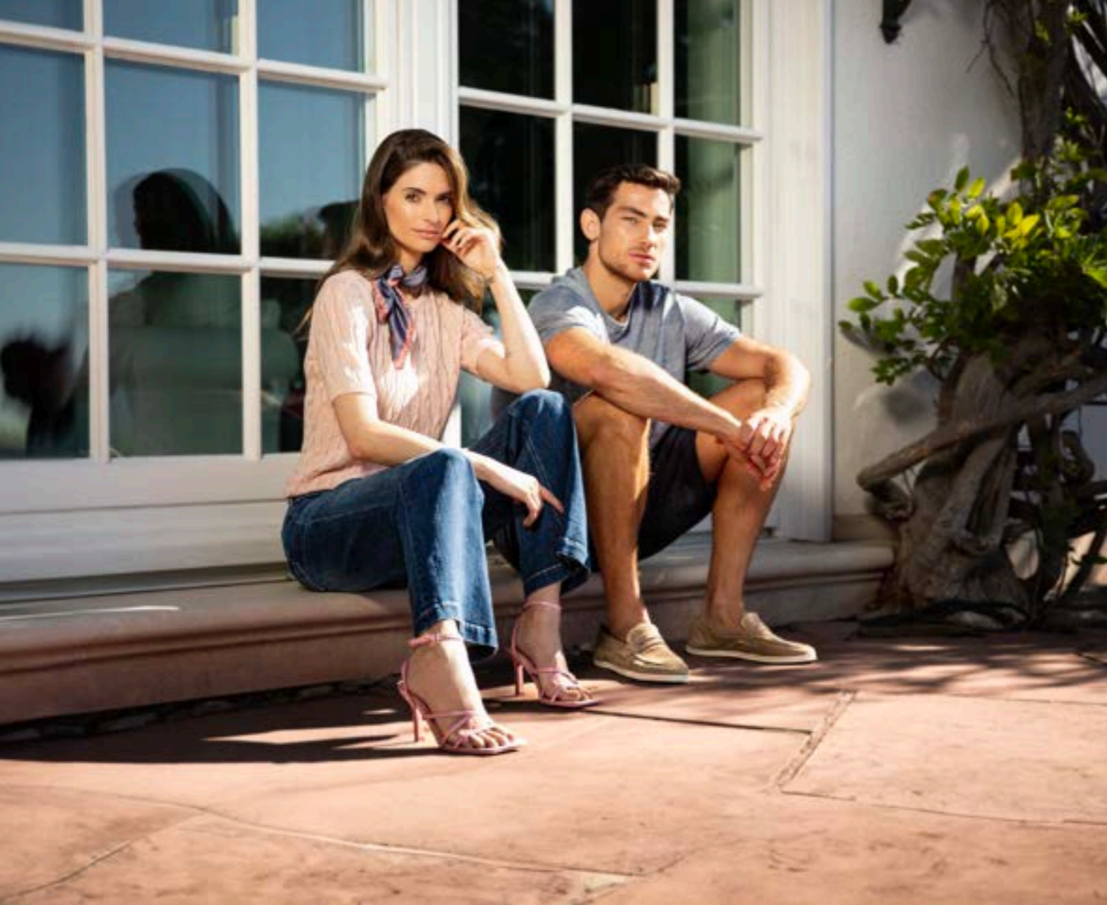
Tuch Savinia Z10445/680