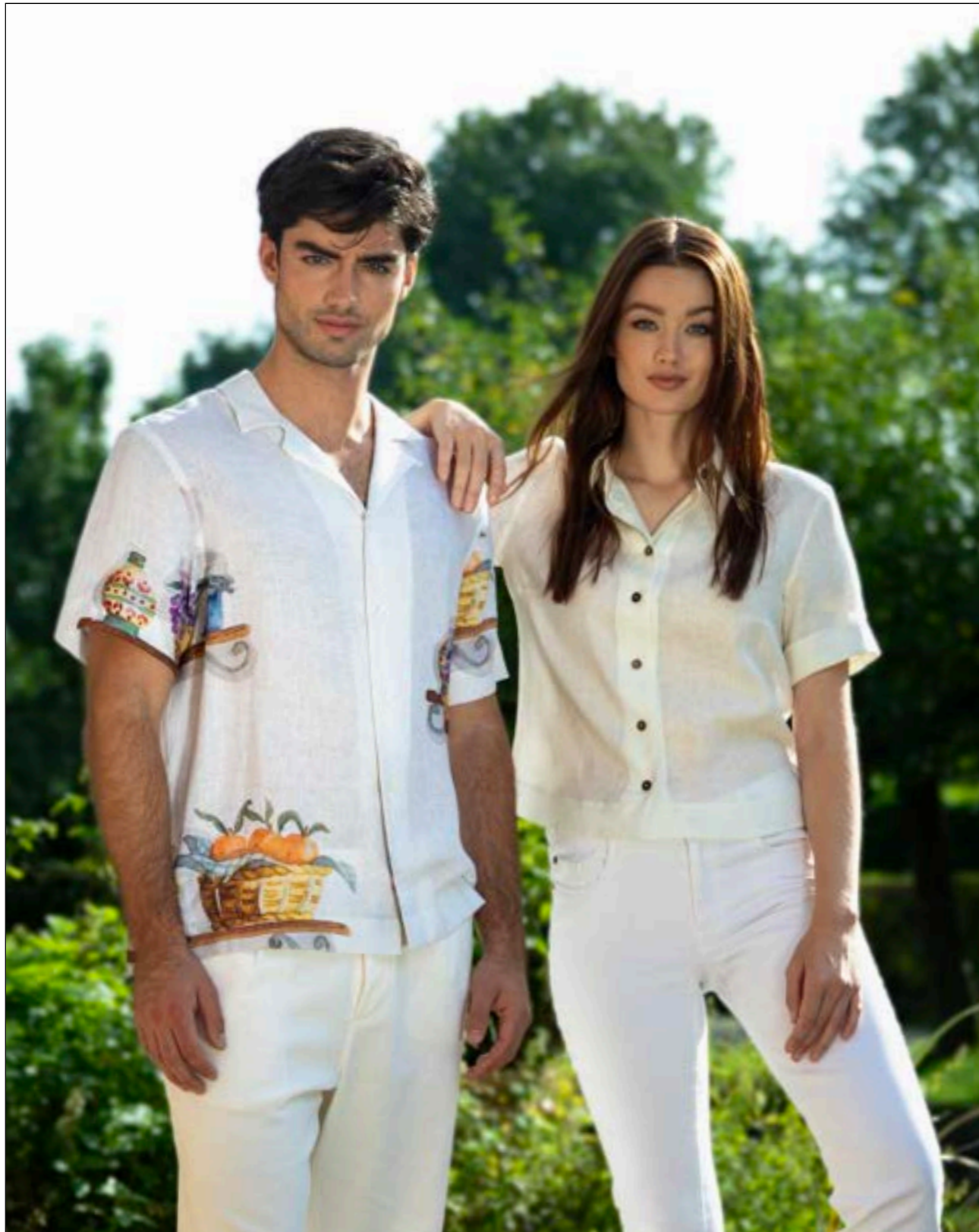
Bluse Amis 150555/110

Zeitlose Raffinesse und vielseitiger Stil überzeugen mit harmonischen Farben.