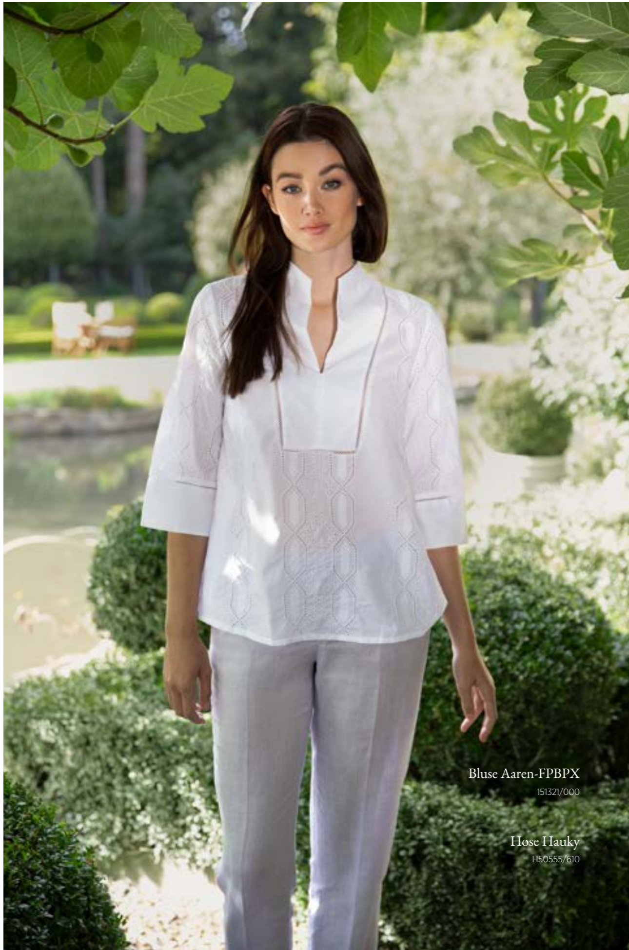
Bluse Aaren-FPBPX 151321/000