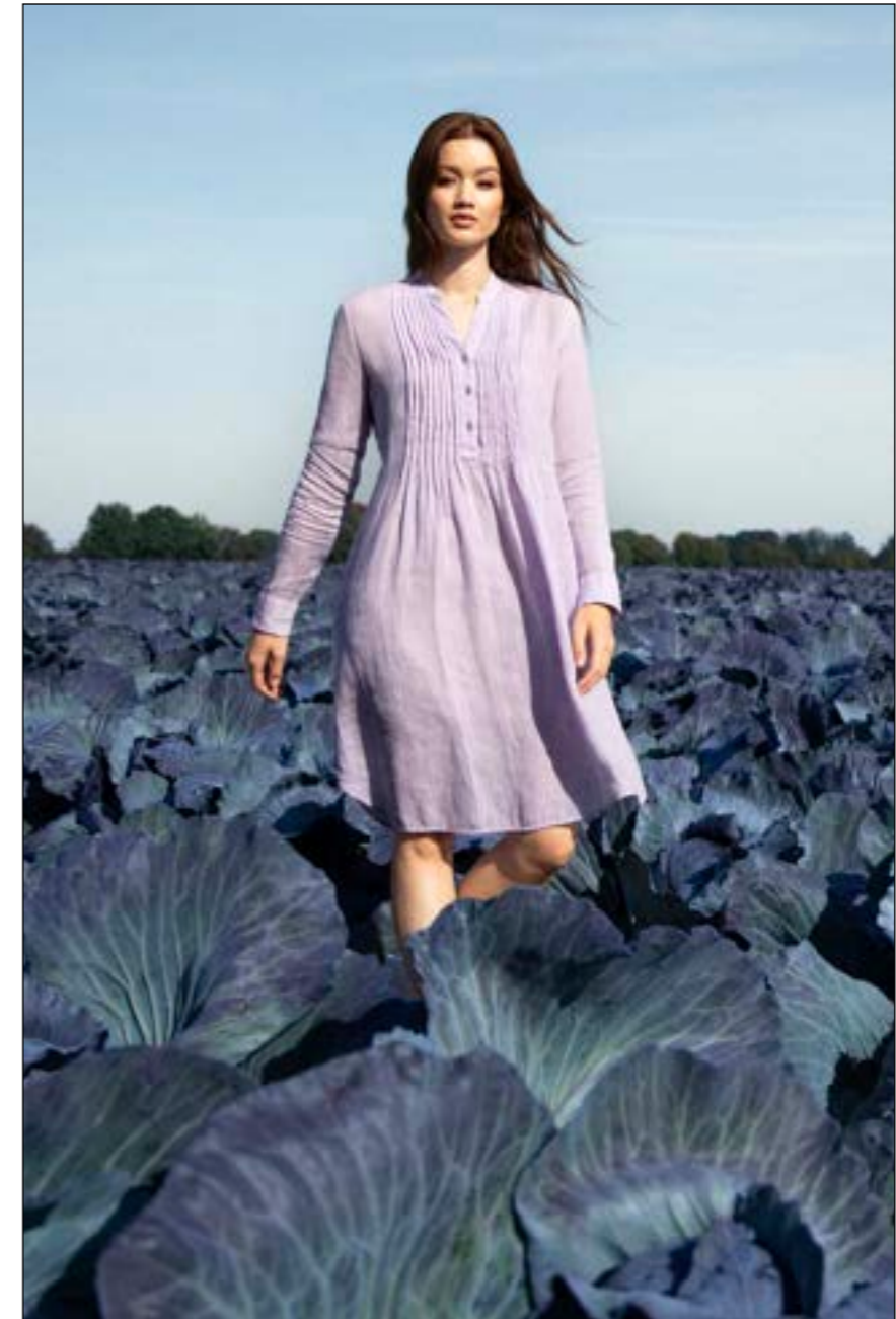
Kleid Kasumi-W2SK 155038/620

Ein verträumtes Ensemble und greifbarer Luxus in einer Farbe, die mit einzigartiger Tiefe und Komplexität besticht. Von tiefen, königlichen Schattierungen bis hin zu lebendigen, jugendlichen Tönen — eine breite Palette von Ausdruck.