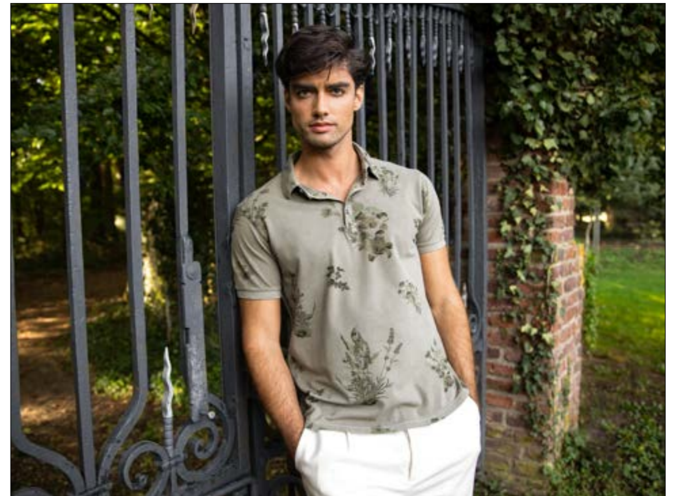
Hose M-Hoku J00155/100

Eine robuste Verschmelzung von maskulinen Blumenmustern und erdigen Nuancen verleiht dem klassischen floralen Stil eine natürliche, ungezähmte Eleganz.