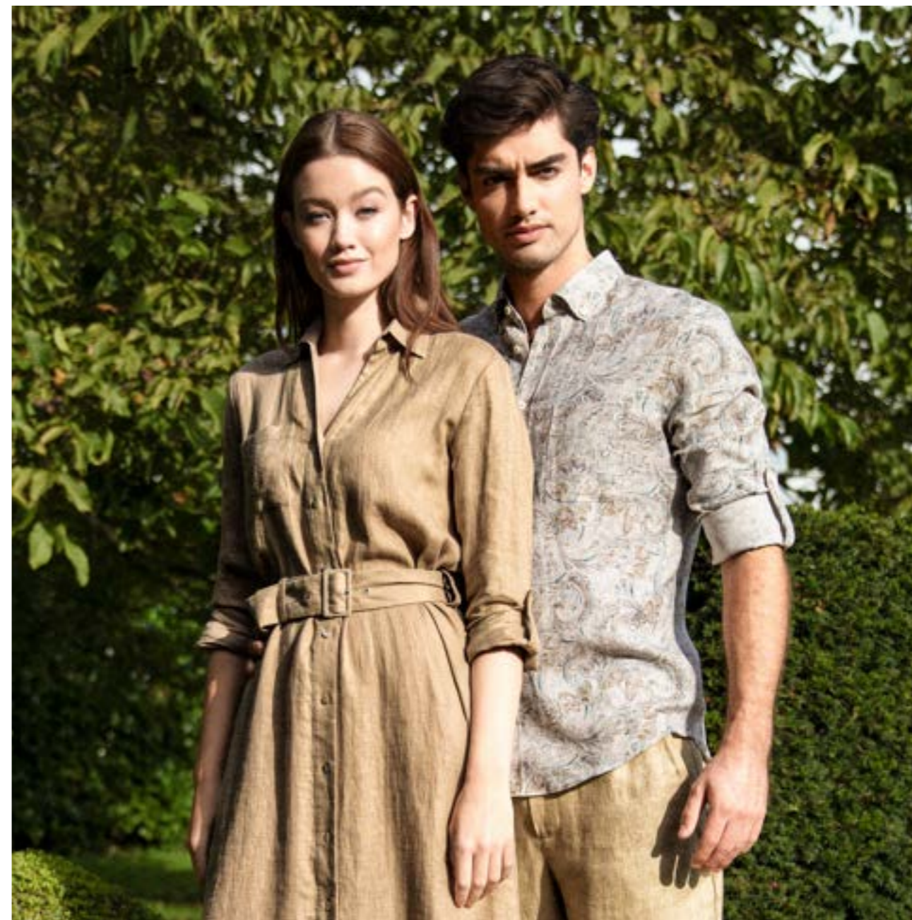
Kleid Kelice-SVKN 150555/130