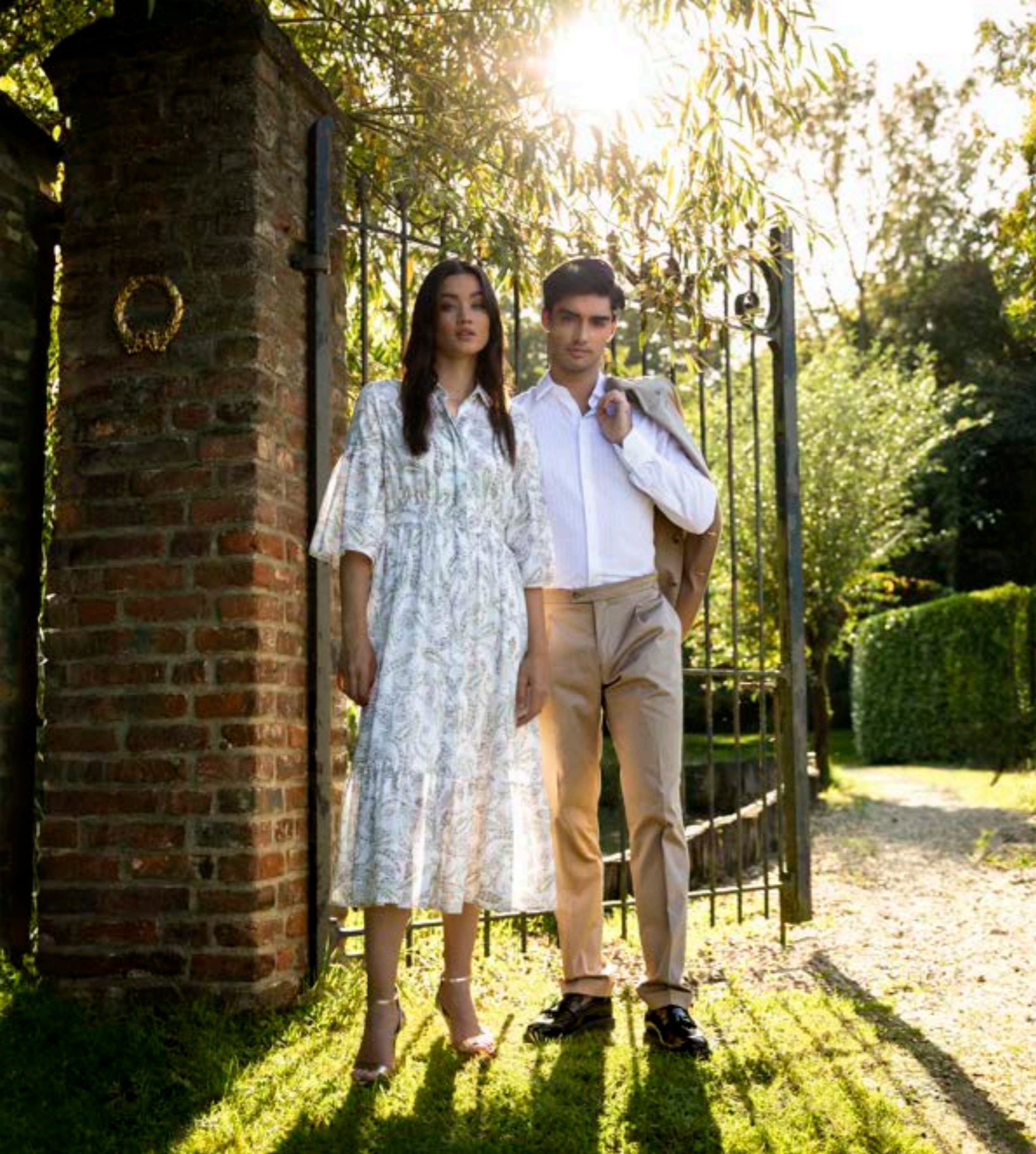
Kleid Kenia-KN 172043/005