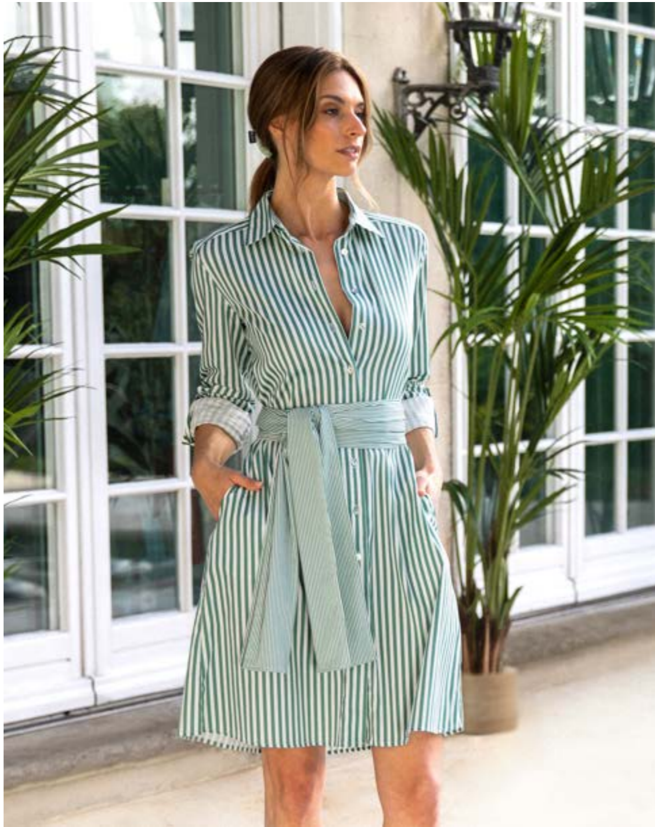
Kleid Korali-FSVKN 171959/940