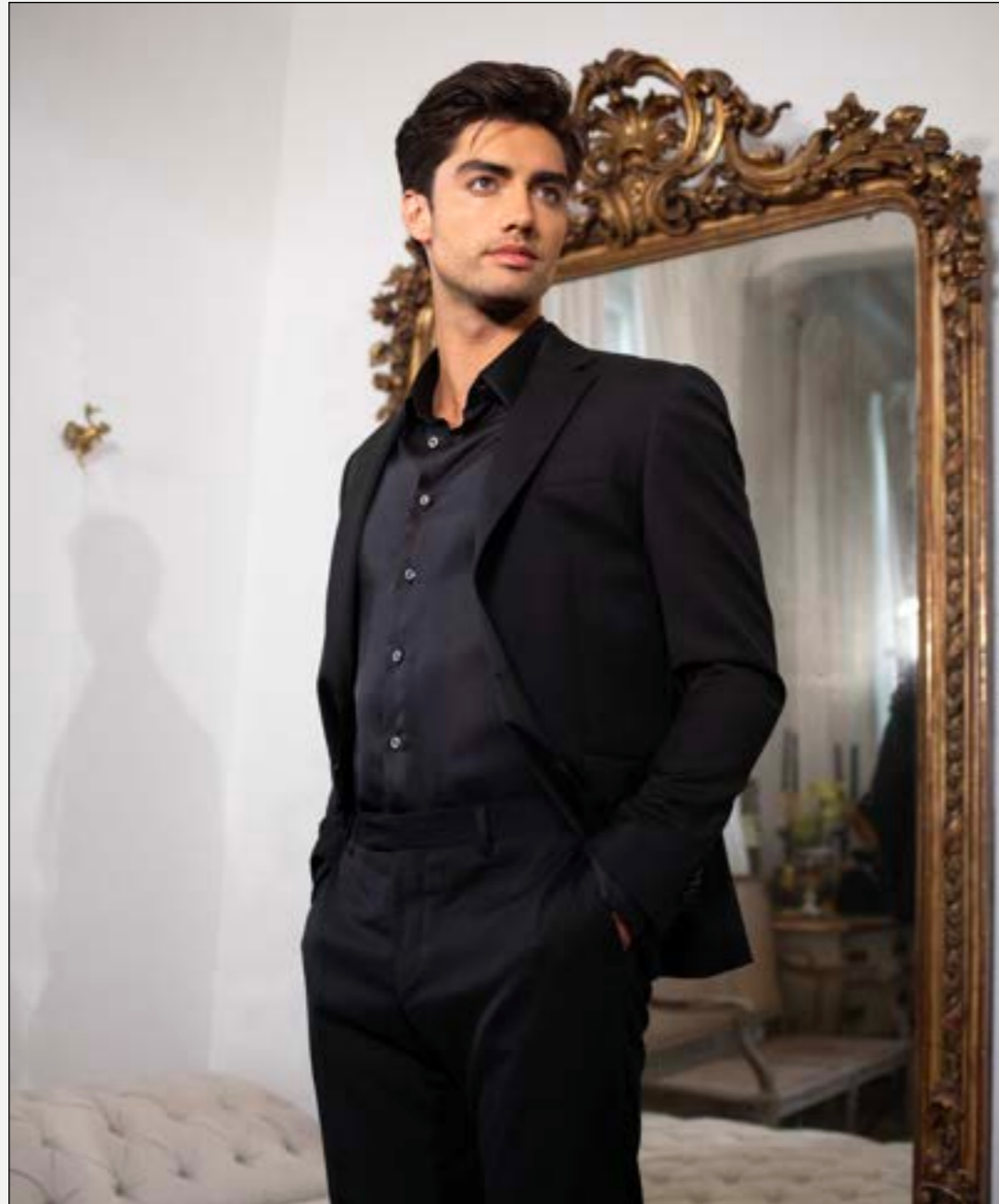
Sakko Falo H01010/099