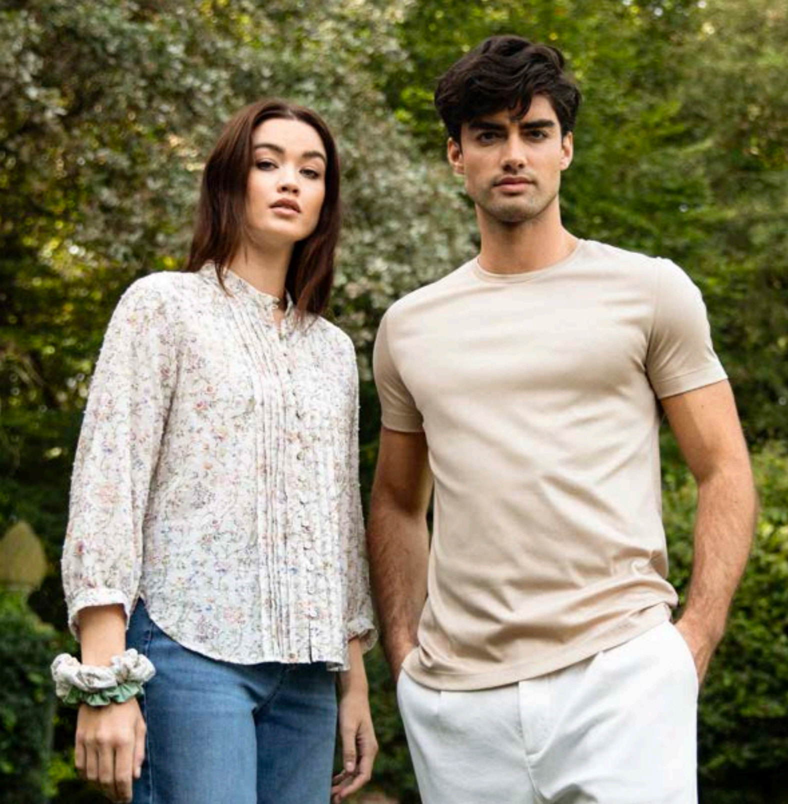
Bluse Esmā-SVKN 170155/117