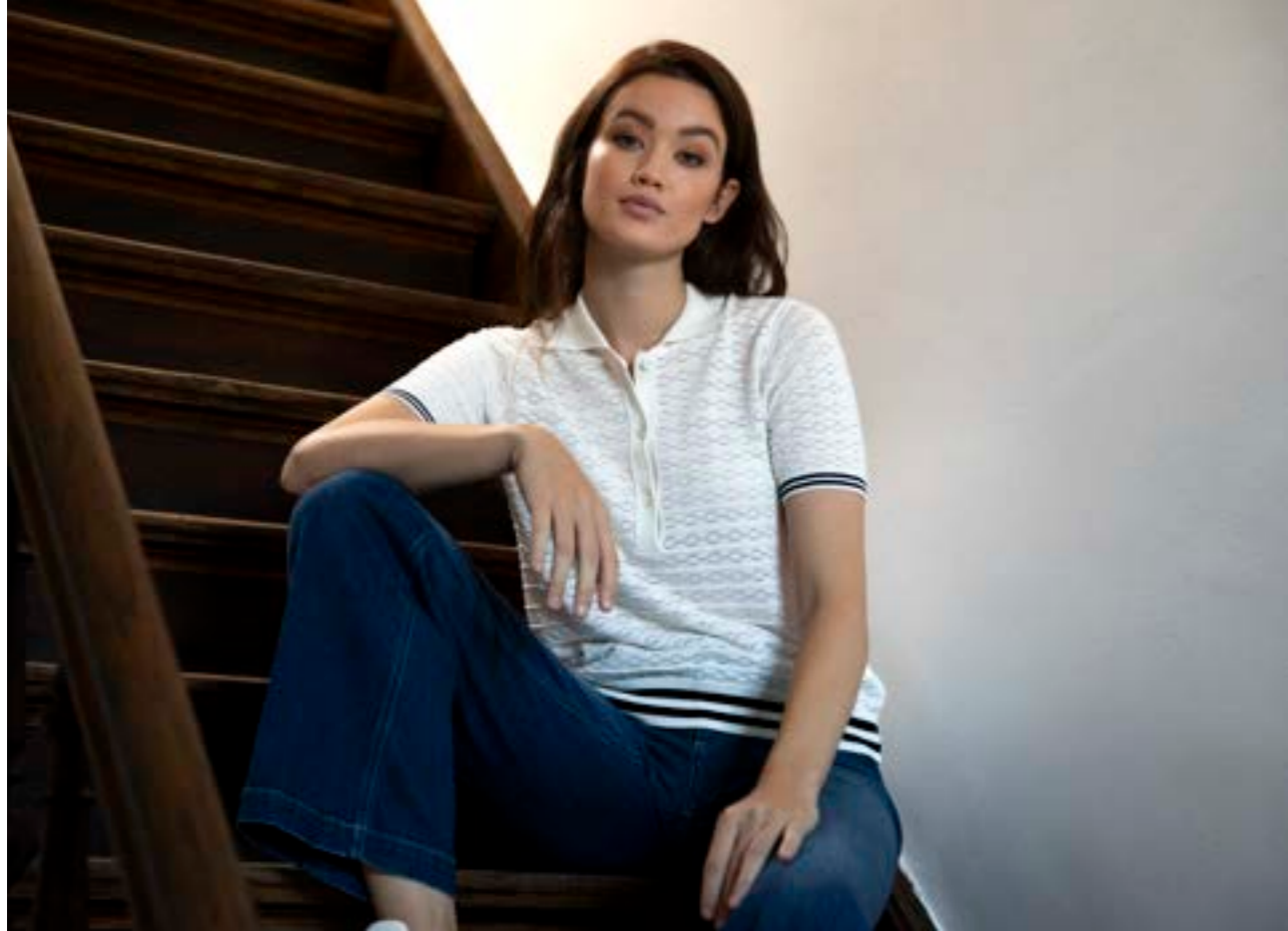
Strickshirt Sanes S00264/107