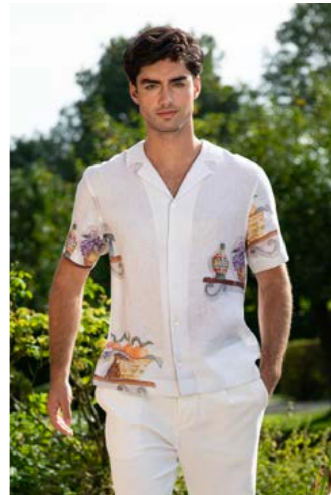
Hemd Rido1-S 170357/110