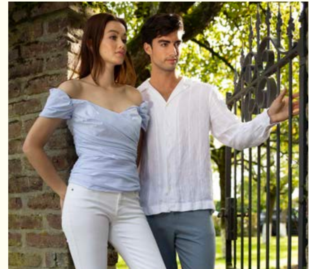
Hemd Rido1-WK 155046/000