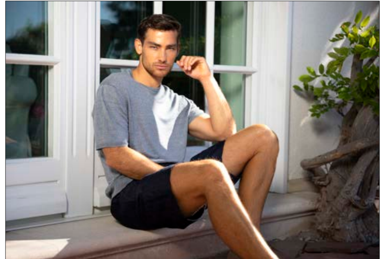
Strickshirt Selino S00169/760