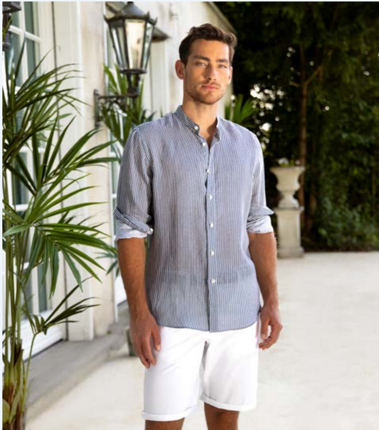
Shorts Harvey J00151/000