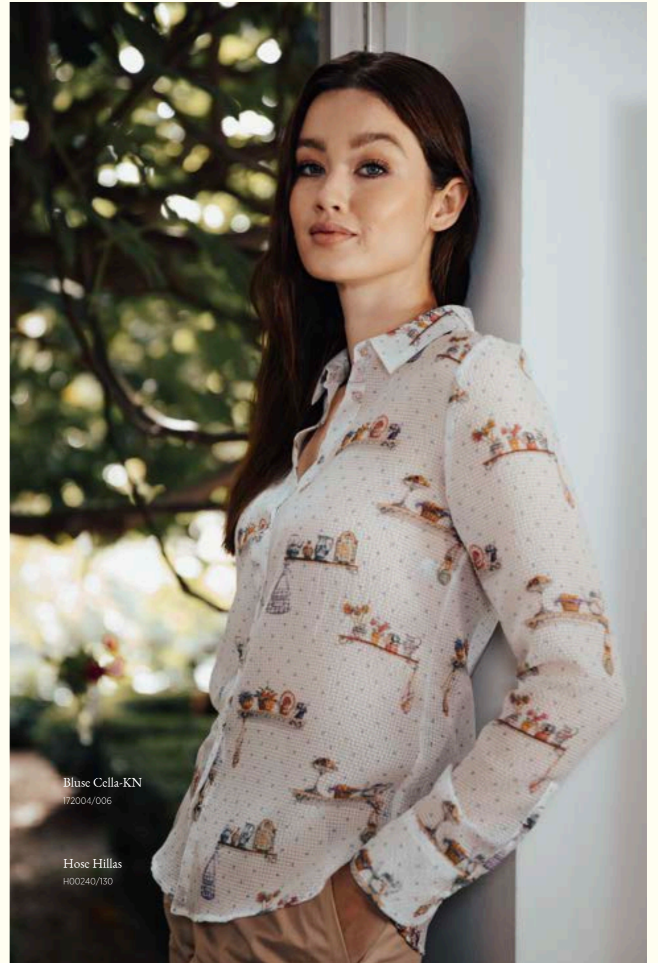
Bluse Cella-KN 172004/006