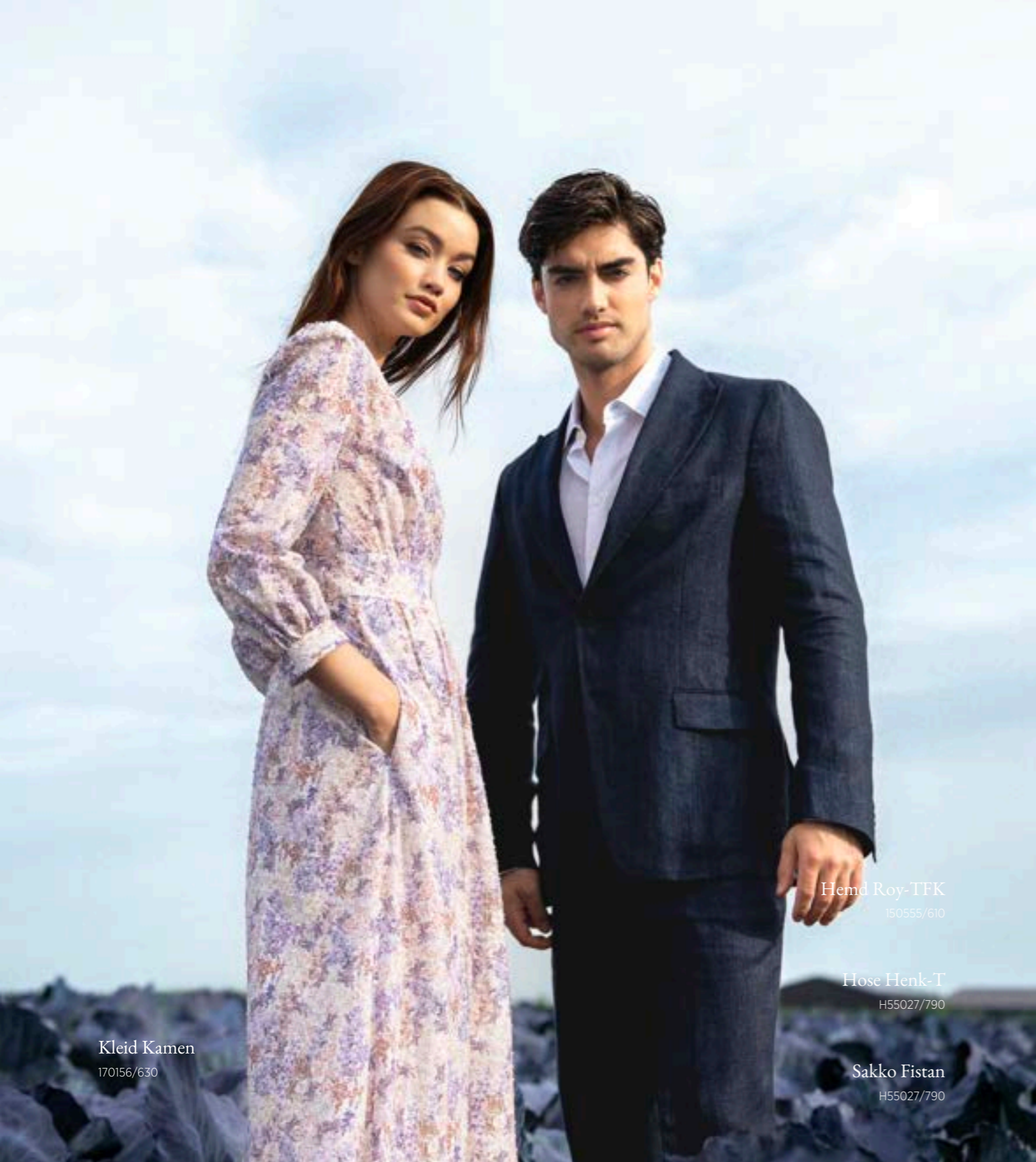
Kleid Kamen 170156/630