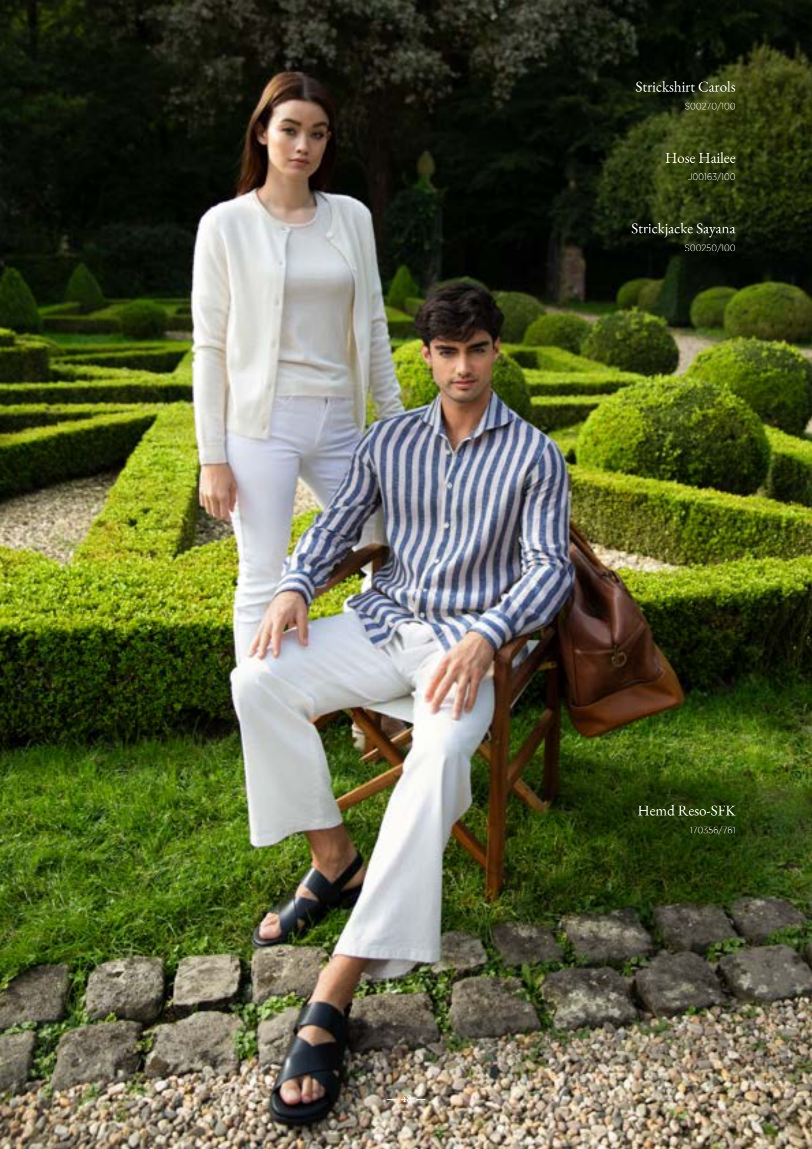
Strickshirt Carols S00270/100