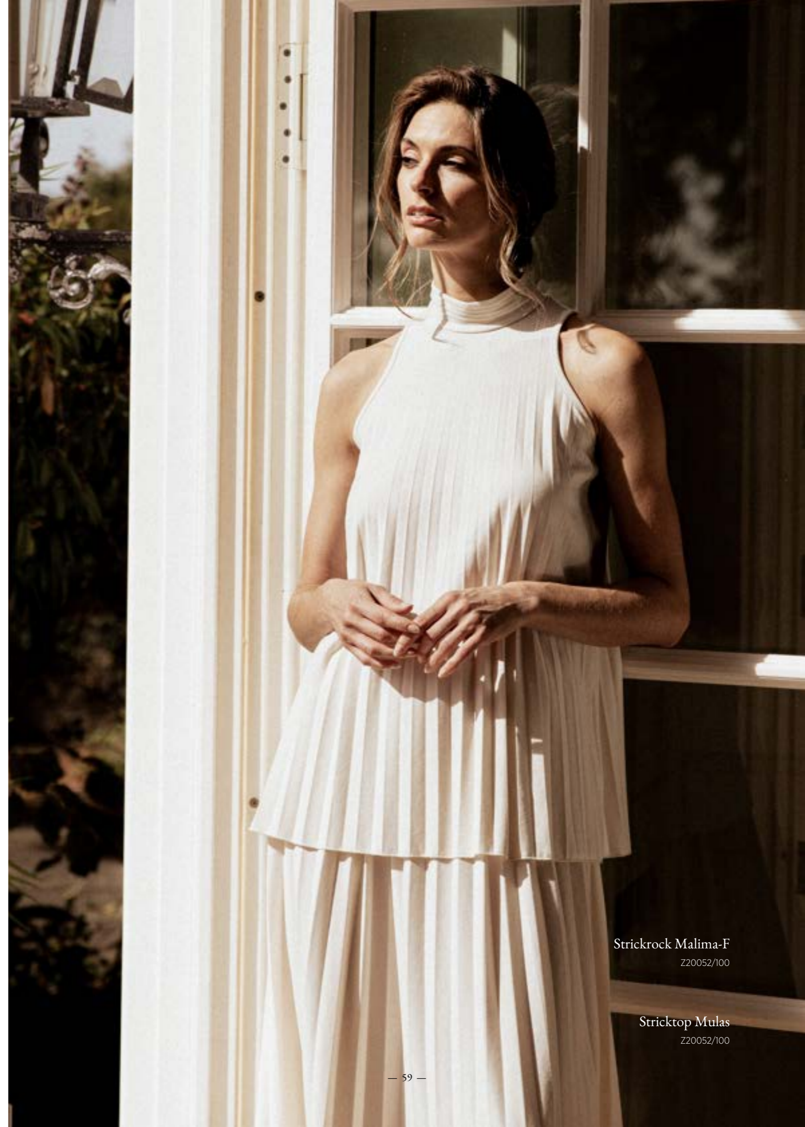
Strickrock Malima-F Z20052/100