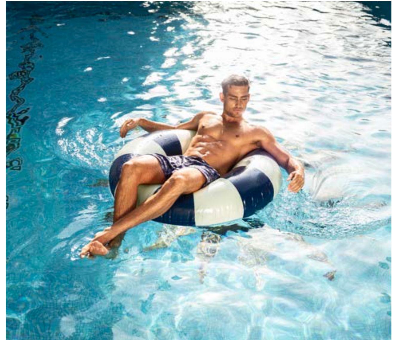
Badehose Brad 172016/780