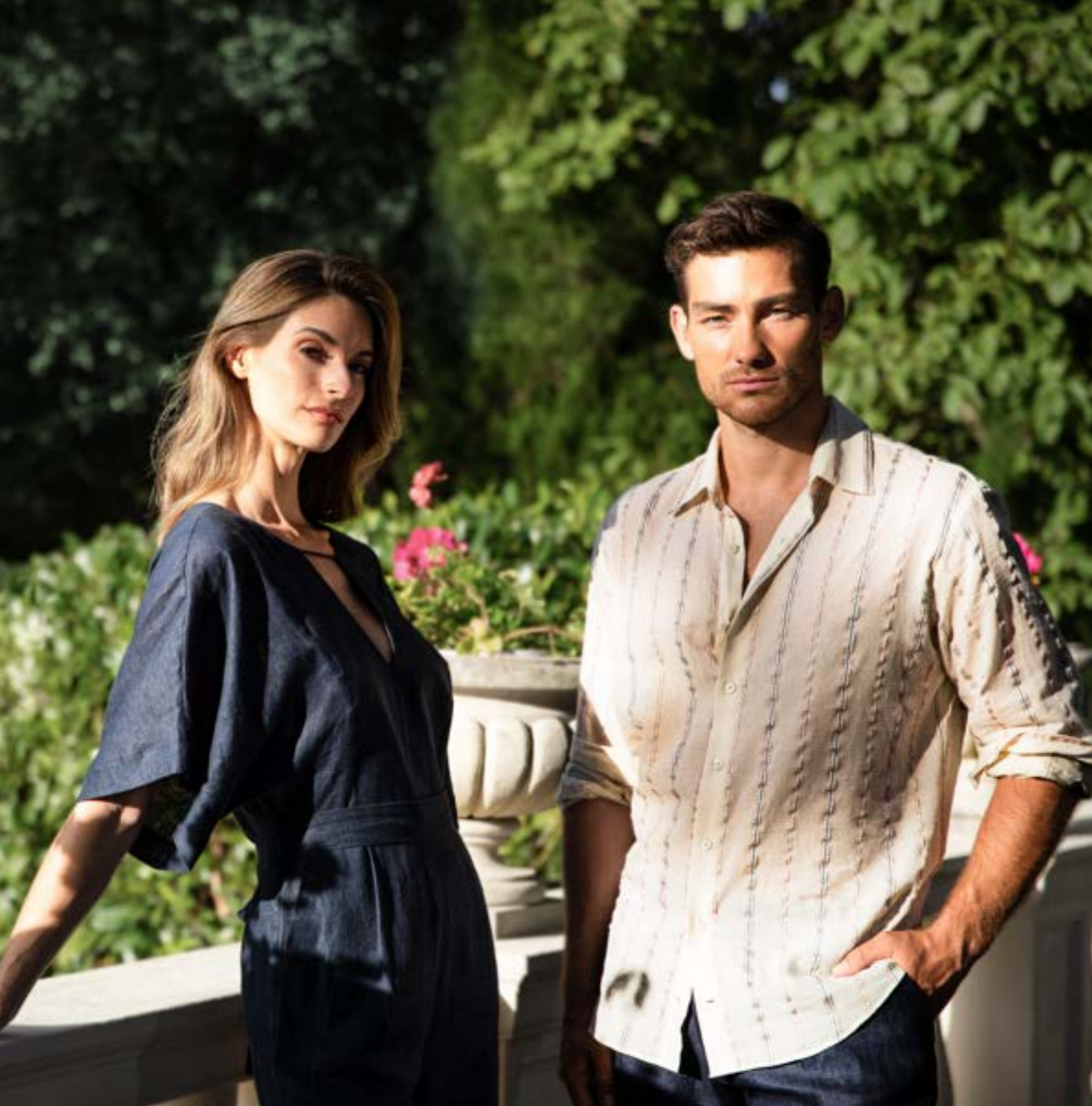
Hemd Raxo 151673/107