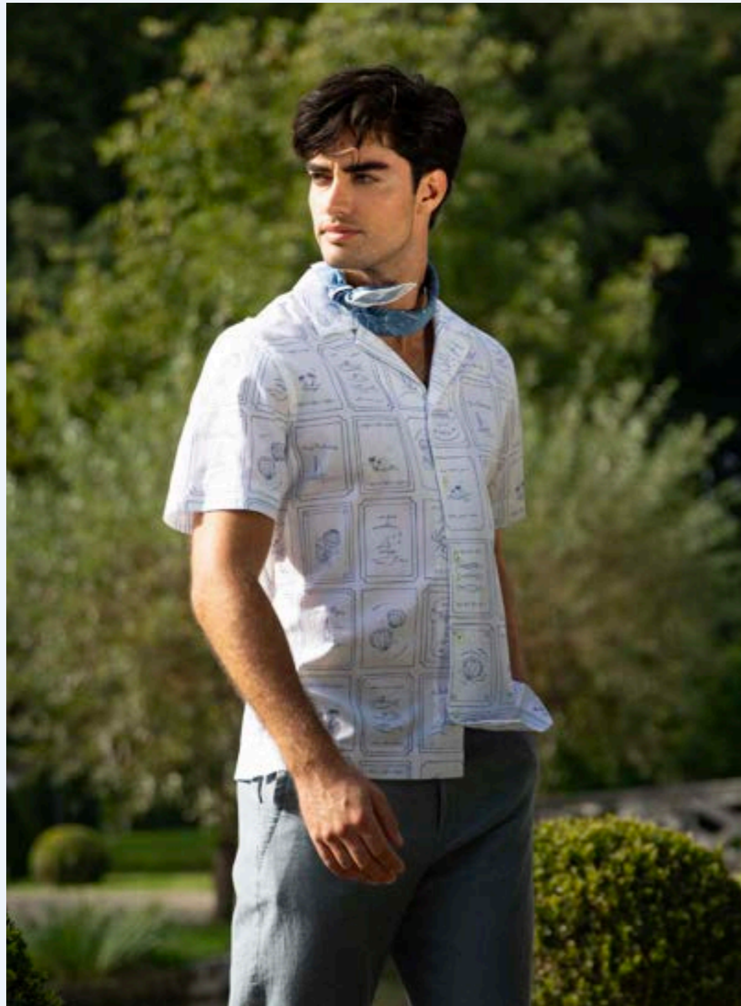
Hemd Rido1-S 172041/007