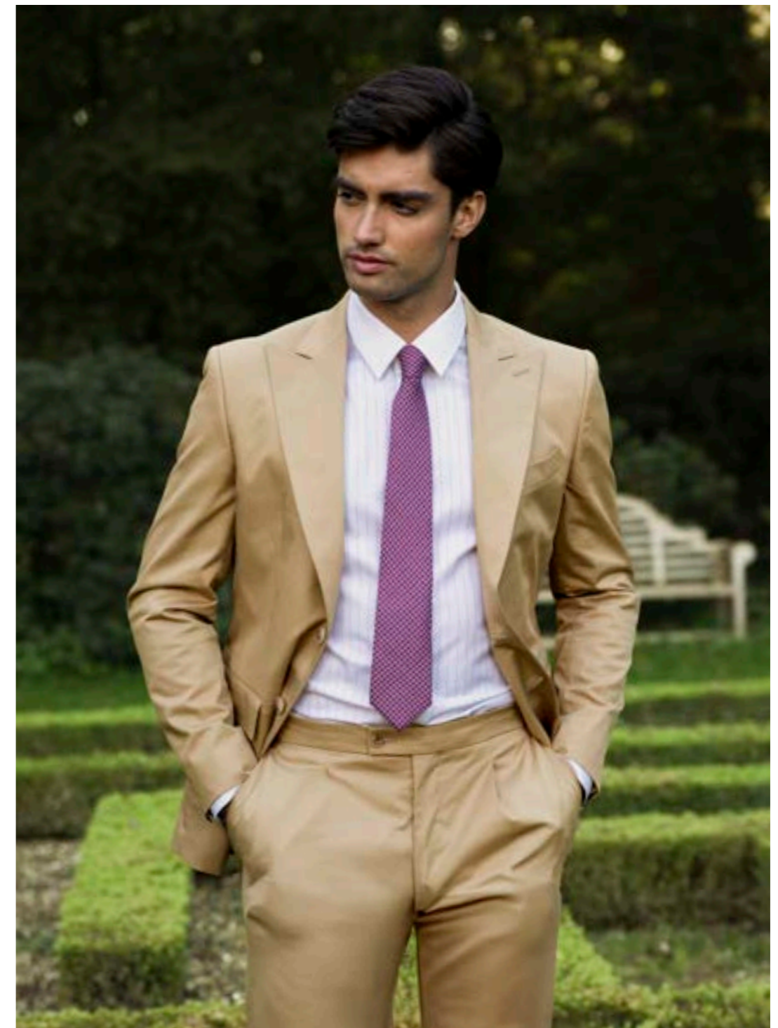
Sakko Fabir Z52001/130