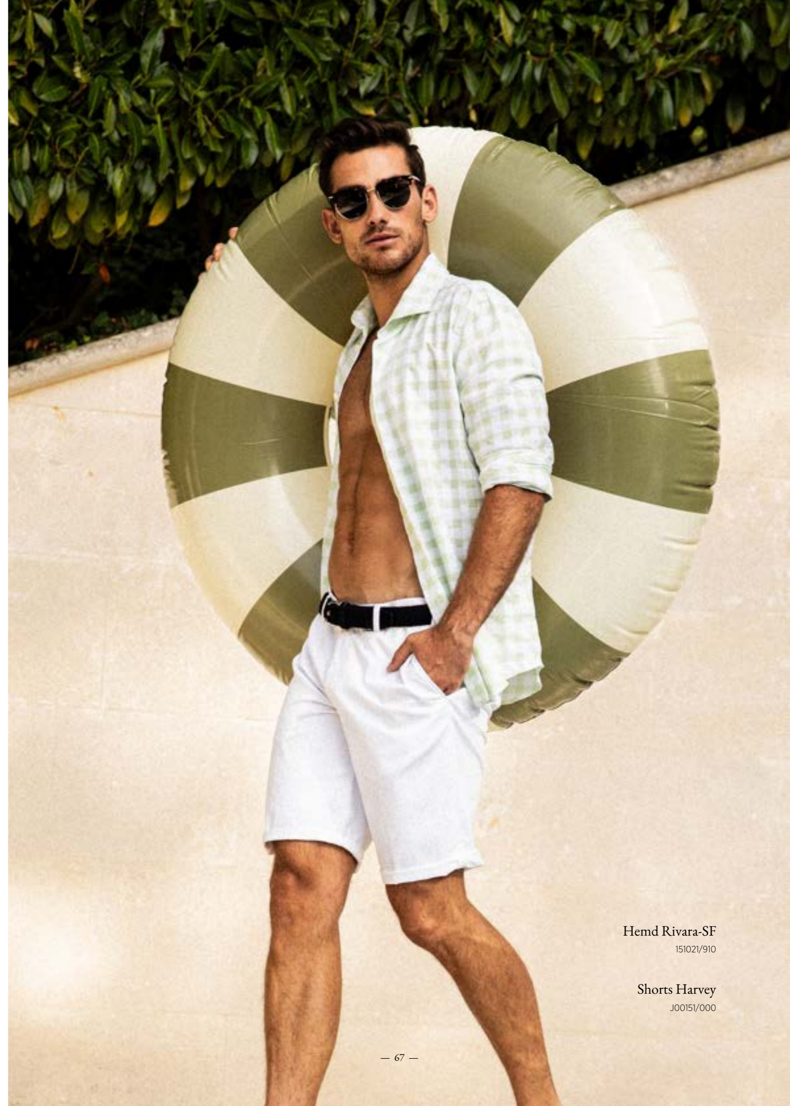
Hemd Rivara-SF 151021/910