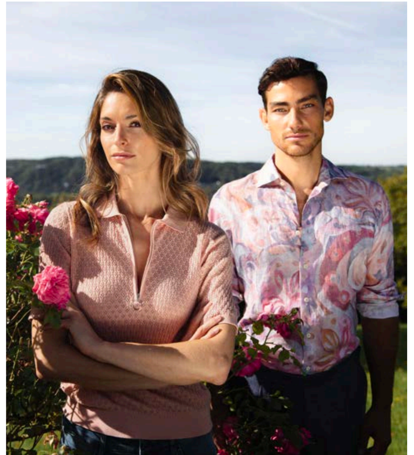
Strickshirt Sadas S00253/420