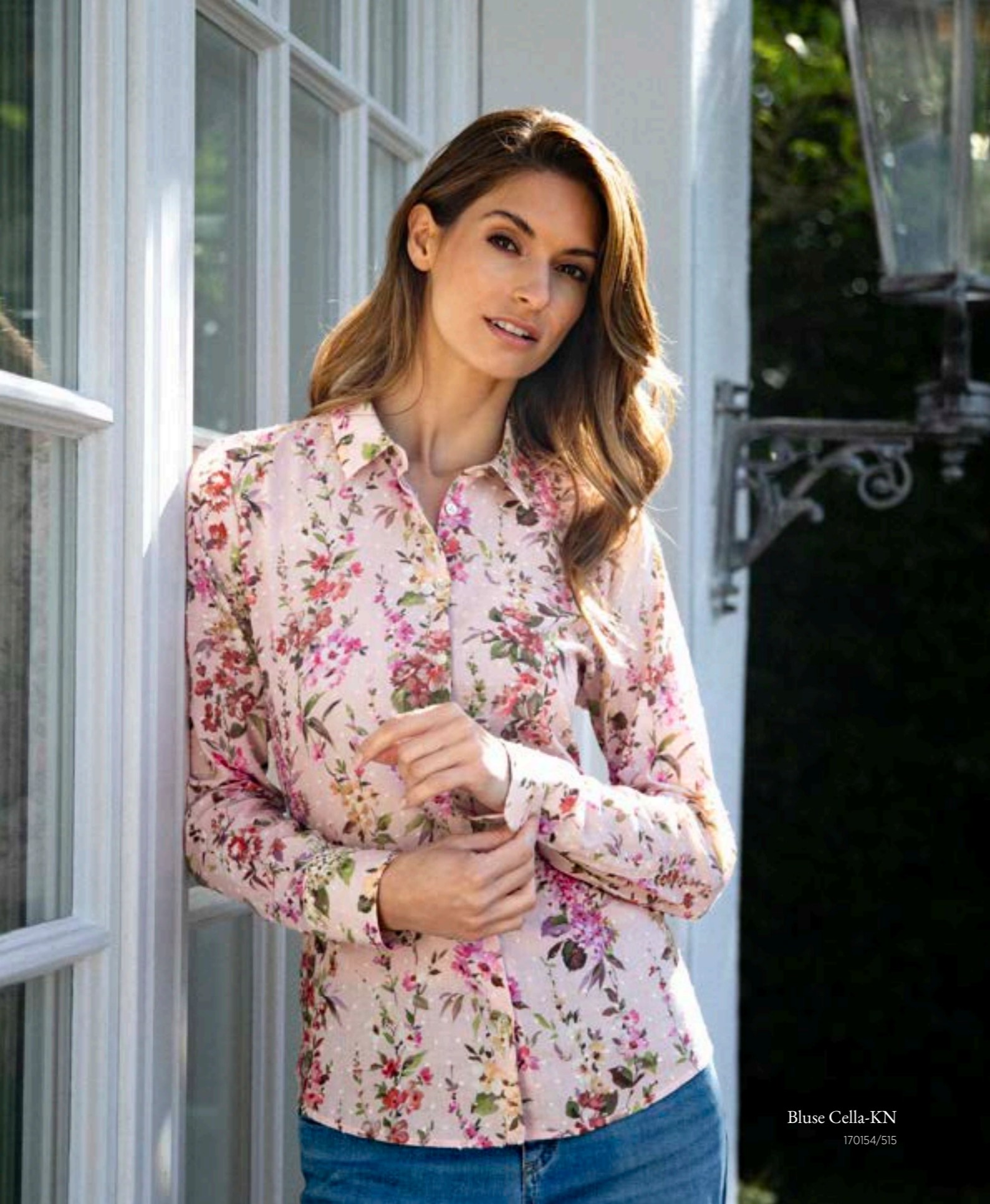
Bluse Cella-KN 170154/515