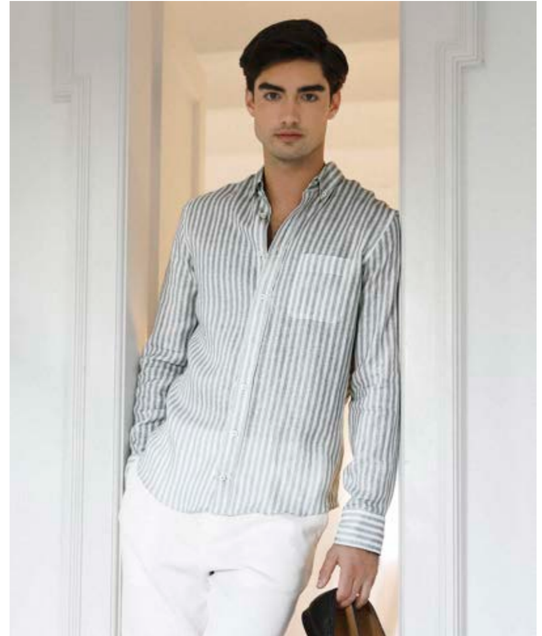
Hemd Roy-TFK 170352/940