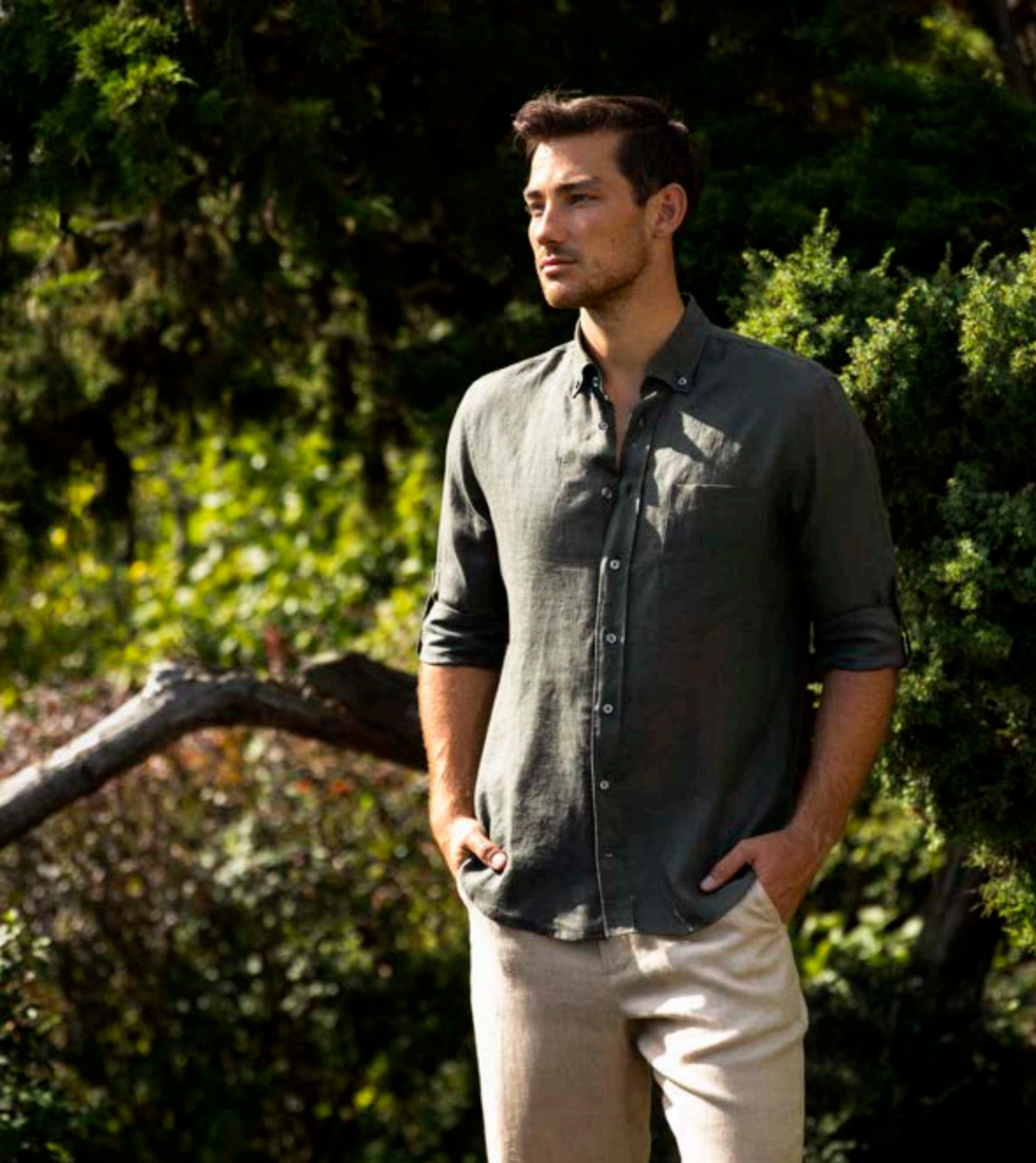
Hemd Roy-RTFK 150555/990