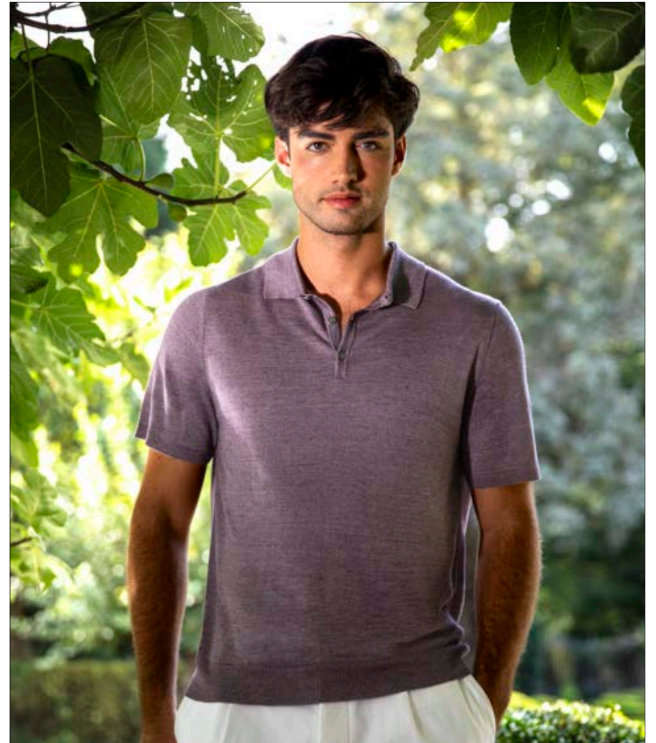
Strickpolo Simo S00169/680