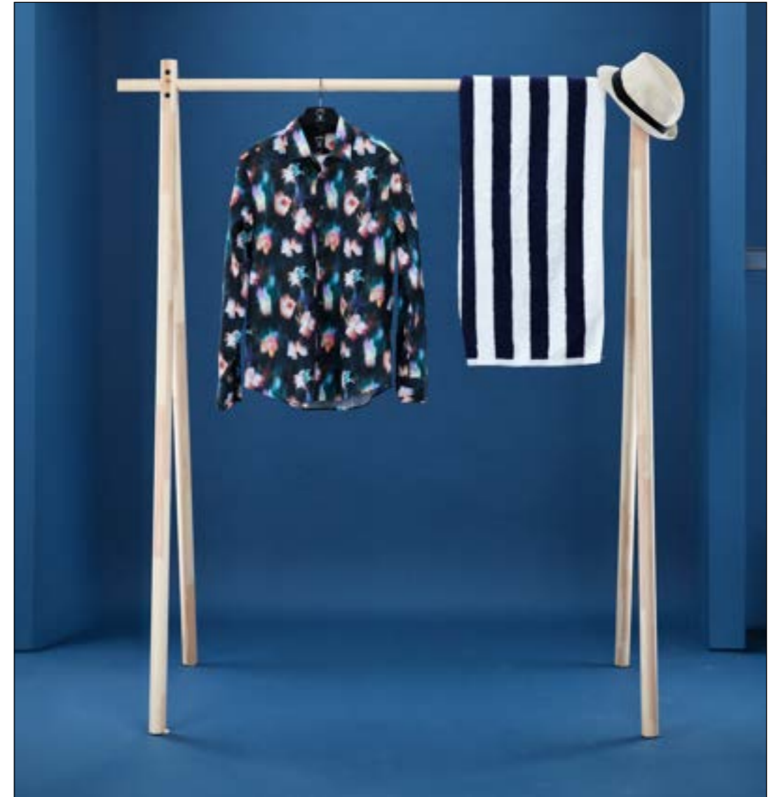
Hemd Ret-SFW 172039/783