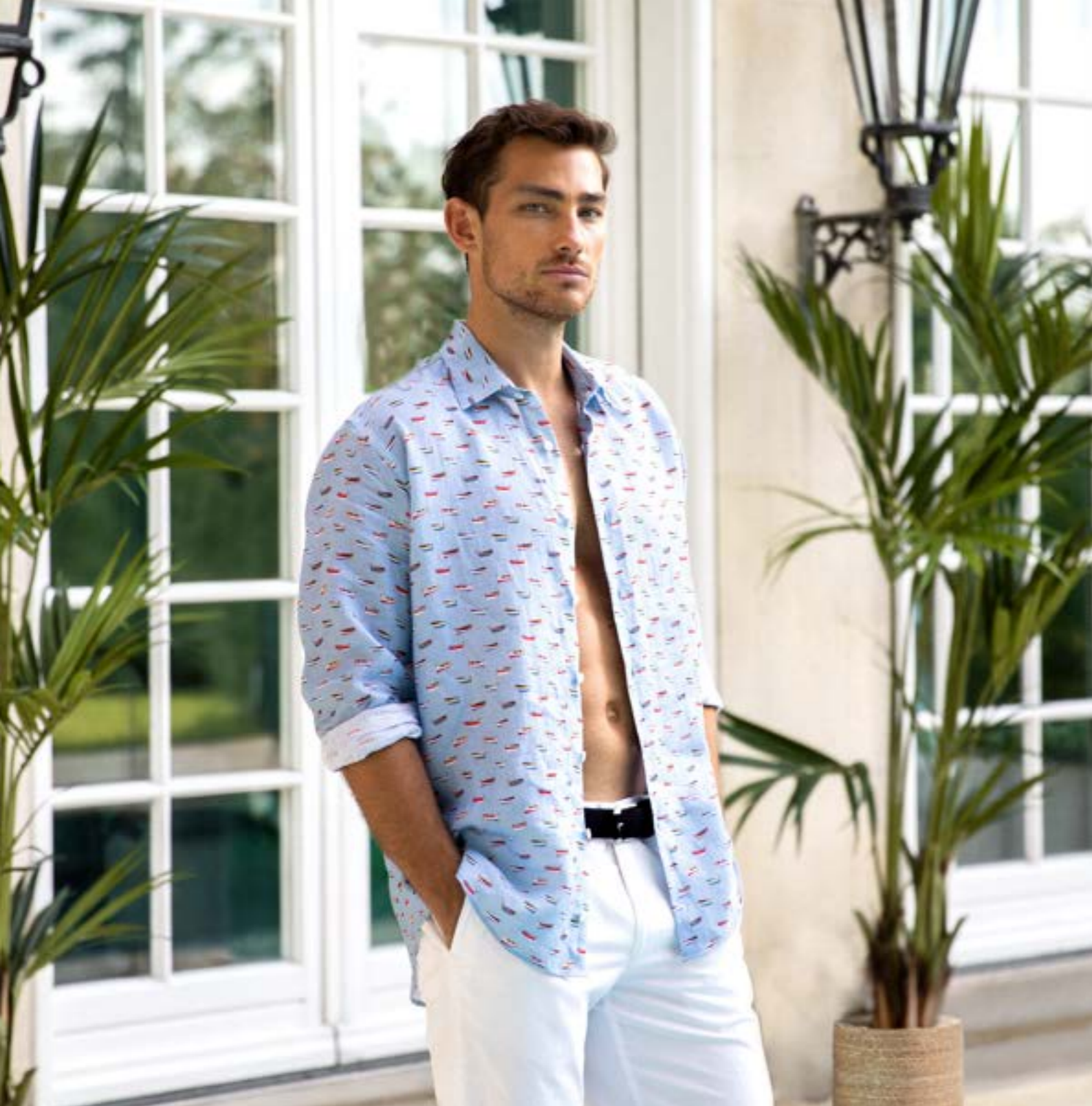
Hemd Raxo-K 170348/730