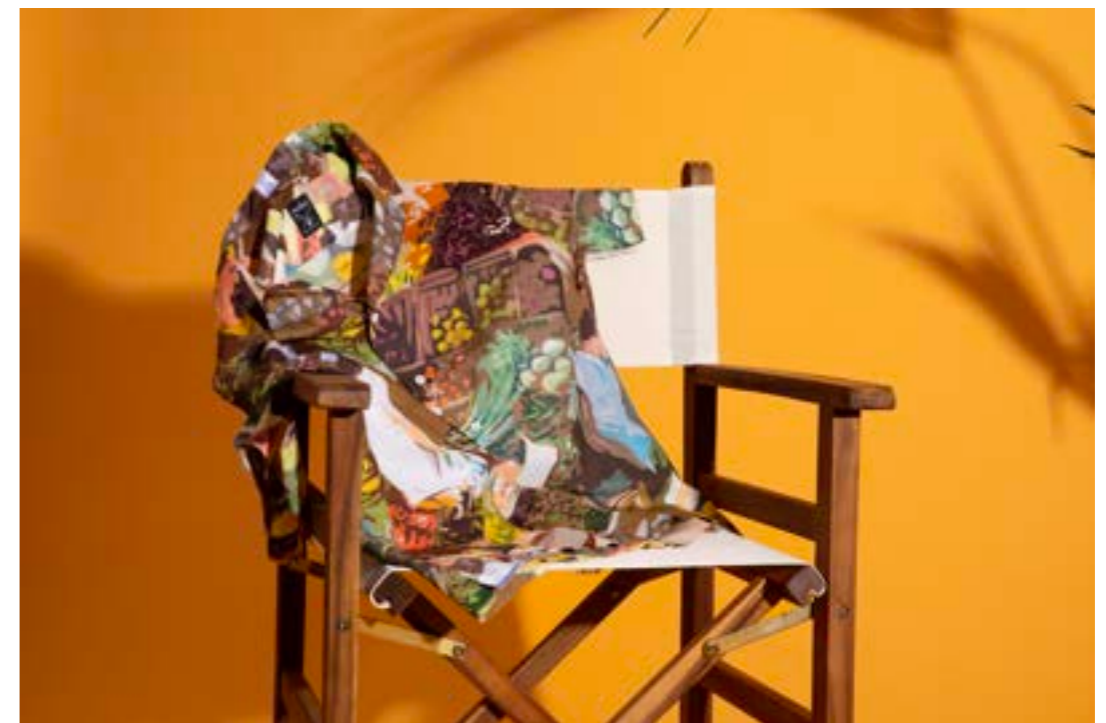
Kleid Kenia-KN 172043/005