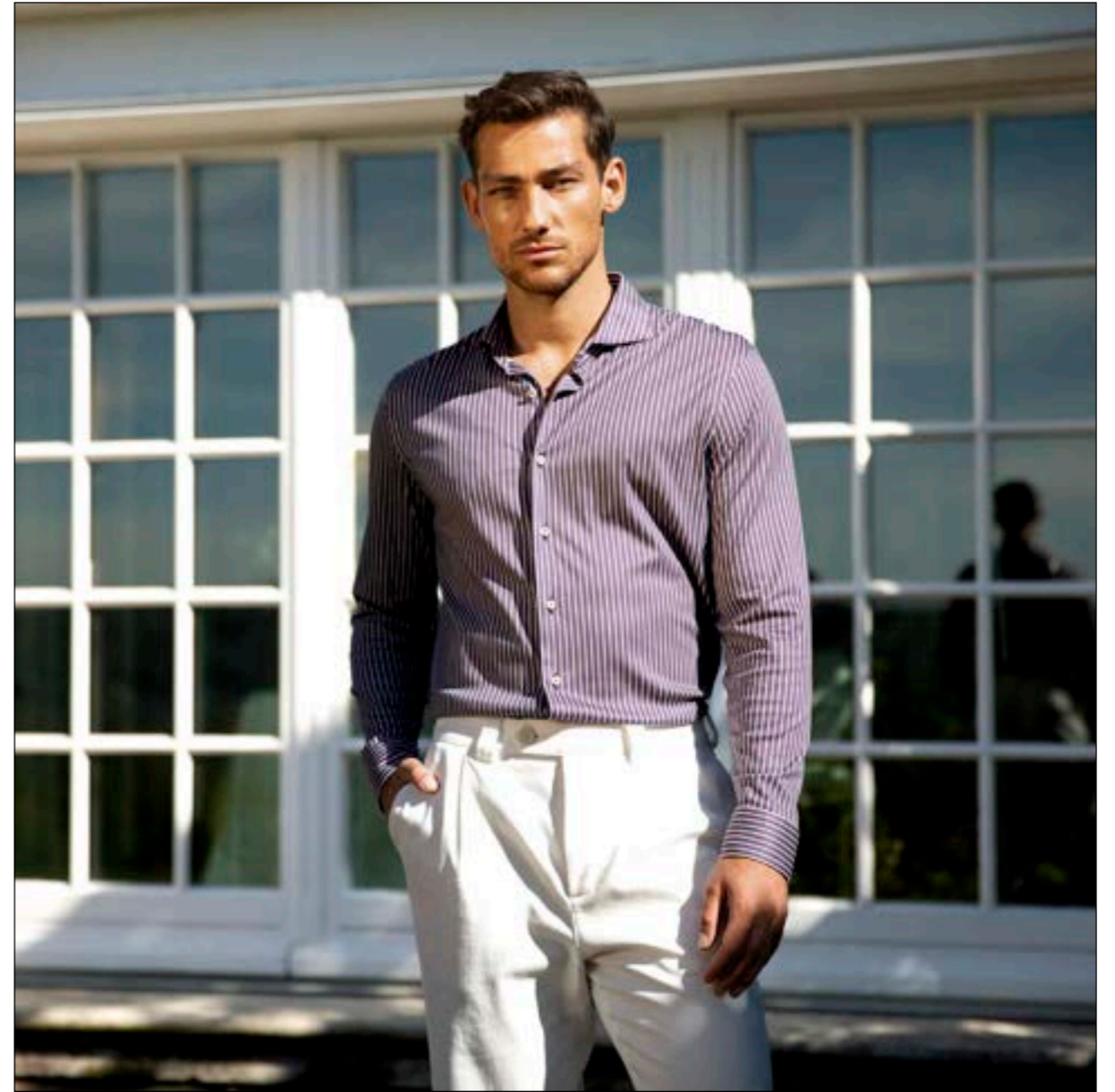
Hemd Per-LSF 187755/650

Entdecken Sie die simplen Freuden des Lebens in unseren bequemen Hemden.