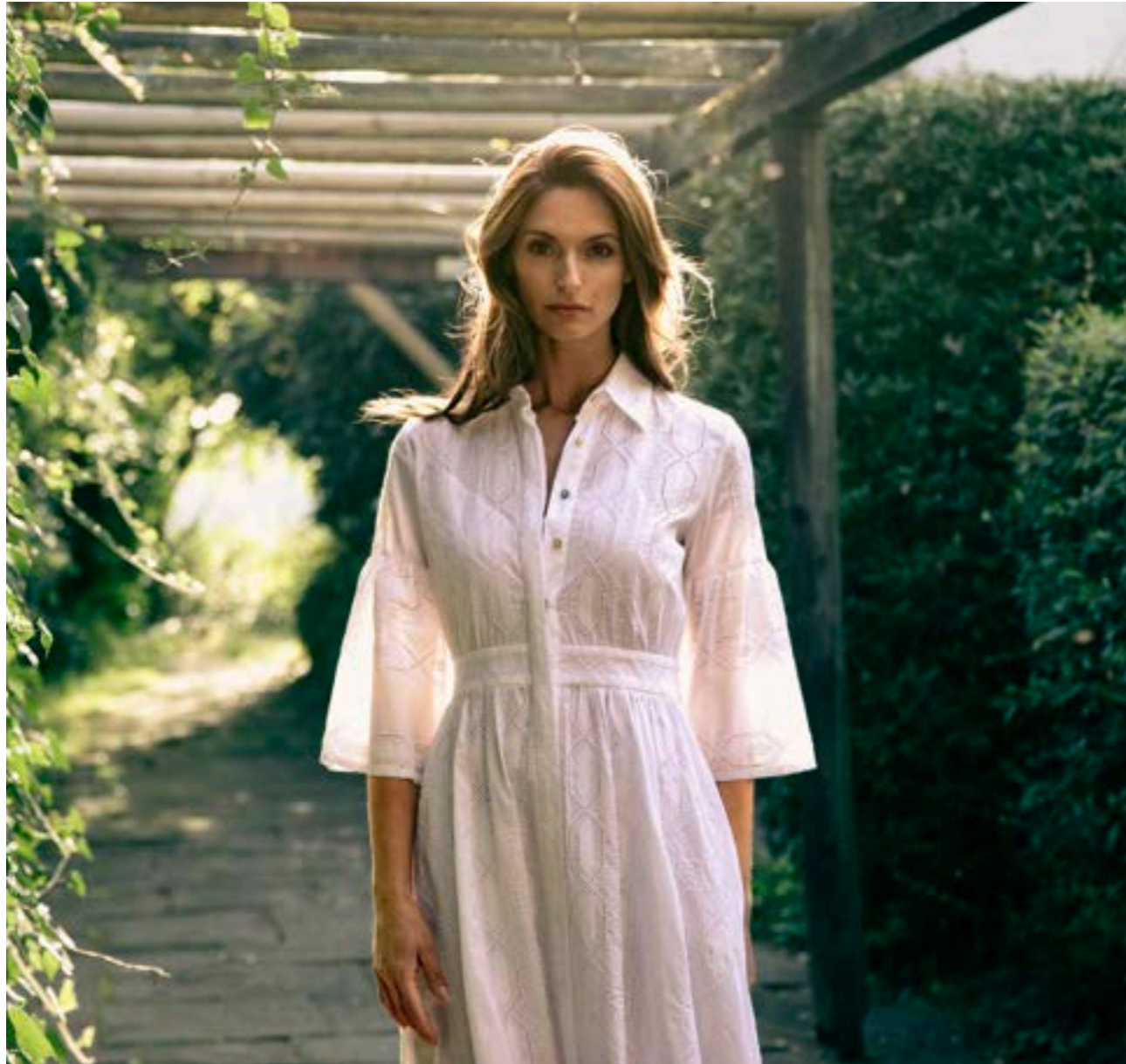
Kleid Kenia-FPXKN 151321/000