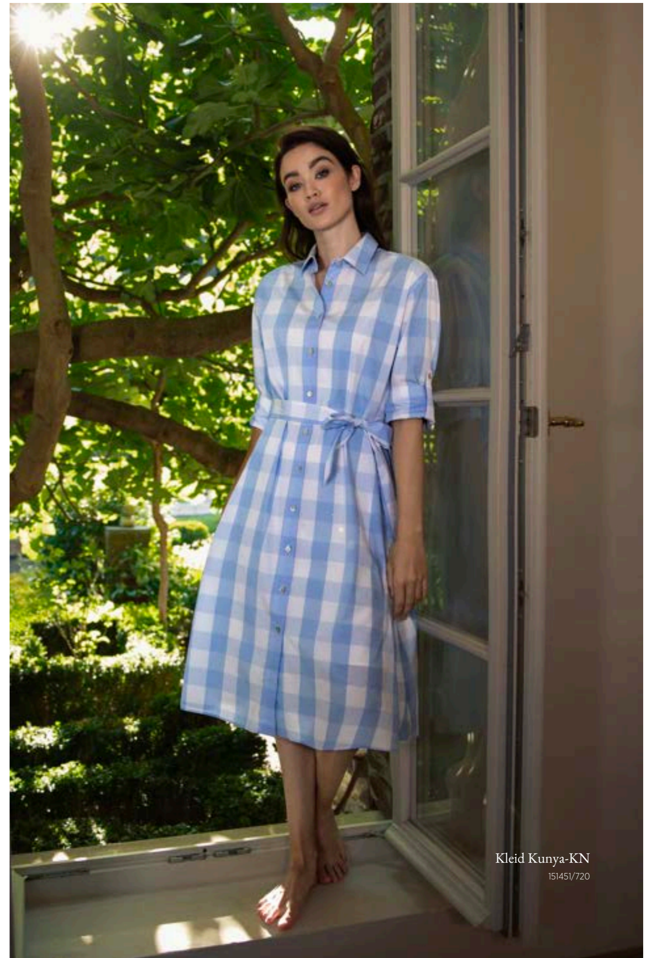
Kleid Kunya-KN 151451/720