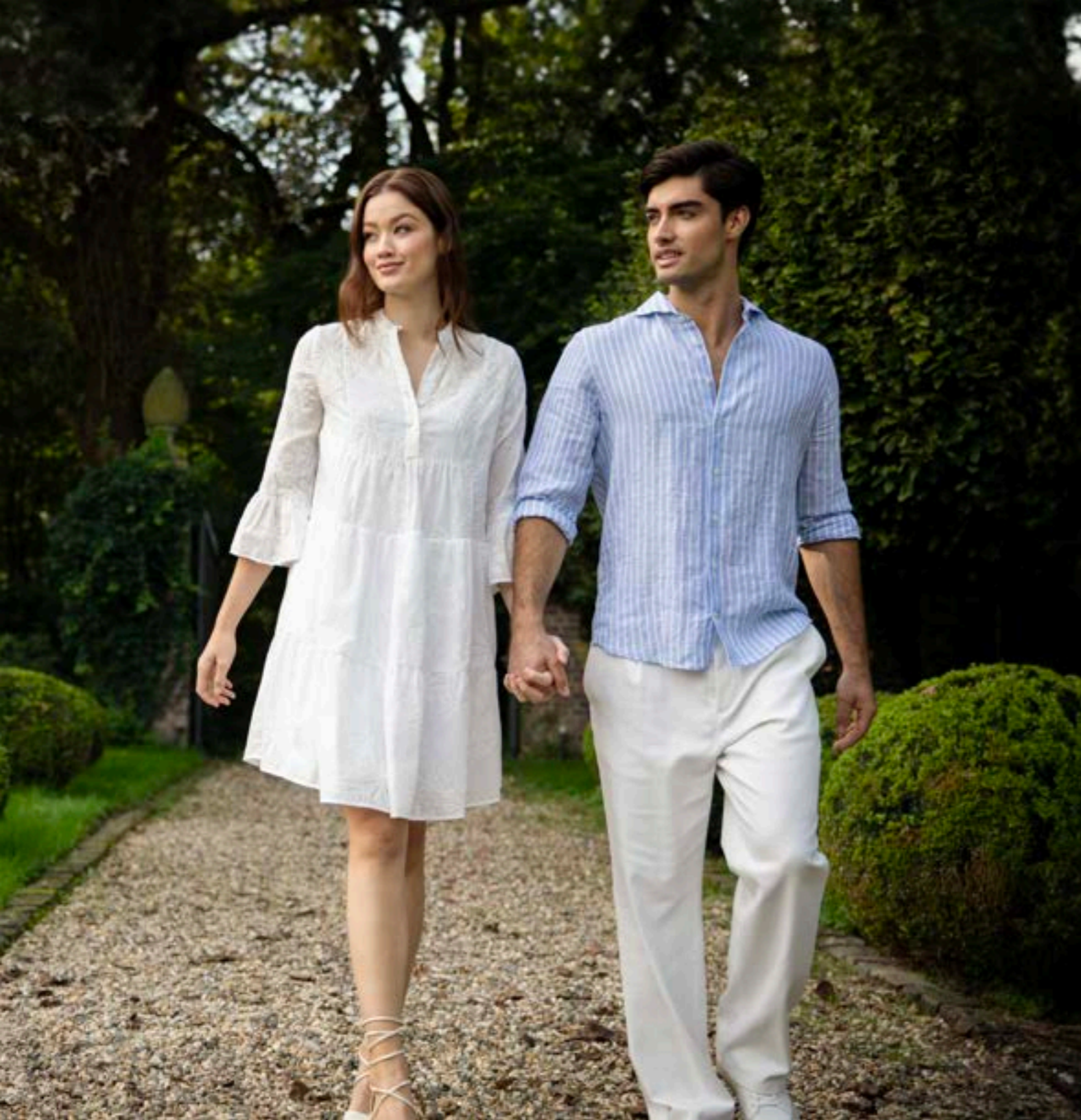
Kleid Kella-LV1 151255/000