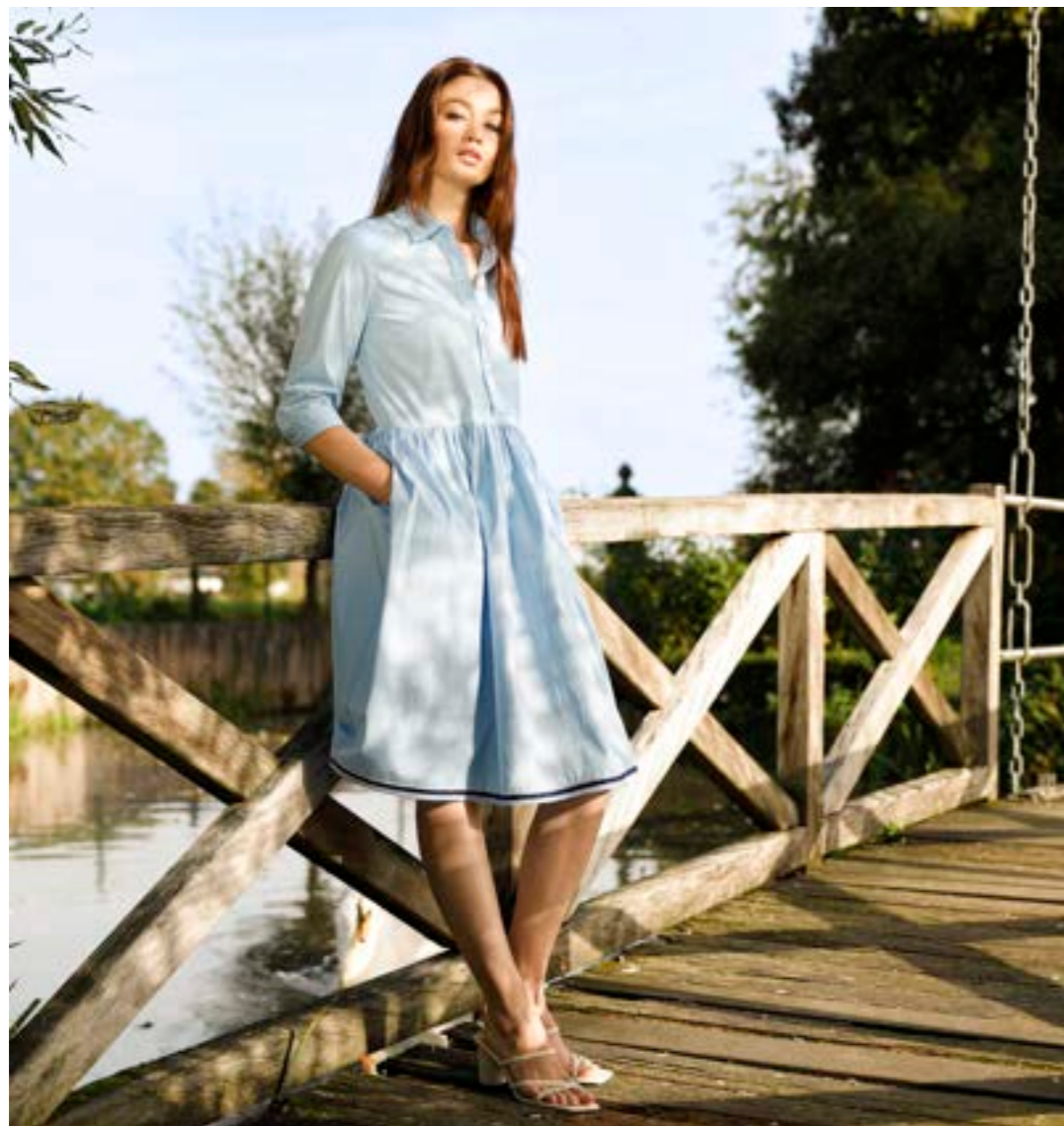
Kleid Klarine-PBKN H00240/730

In jedem Moment liegt ein verborgener Zauber, gewoben aus der Leichtigkeit gestrickter Materialien und einem Hauch von Charme. Diese subtile Eleganz erinnert an die malerische Atmosphäre der Provence, wo selbst die einfachsten Augenblicke zu kostbaren Erinnerungen werden.