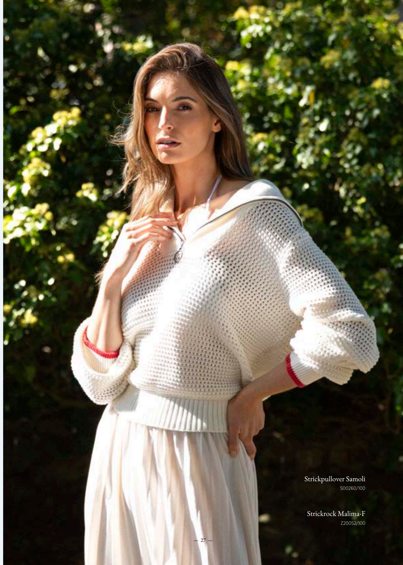
Strickpullover Samoli S00260/100