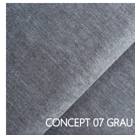
CONCEPT 07 GRAU