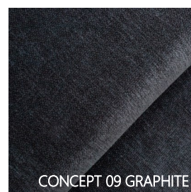
CONCEPT 09 GRAPHITE