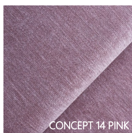
CONCEPT 14 PINK