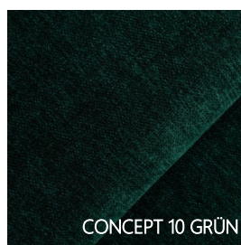
CONCEPT 10 GRÜN