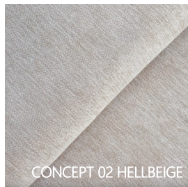
CONCEPT 02 HELLBEIGE