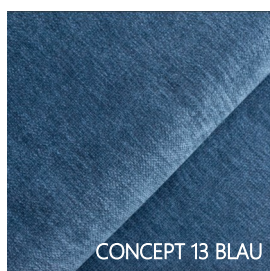
CONCEPT 13 BLAU