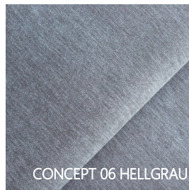
CONCEPT 06 HELLGRAU