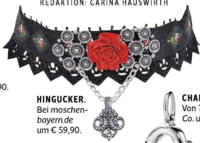
HINGUCKER. Bei moschen-bayern.de um € 59,90.