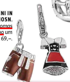
LIAB. Von Gooix bei gooix.com um € 39,-.