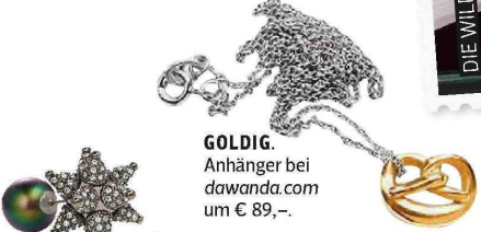
GOLDIG. Anhänger bei dawanda.com um € 89,-.