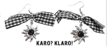
KARO? KLARO! Bei dawanda.com um € 5,95.