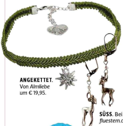
ANGEKETTET. Von Almiebe um € 19,95.