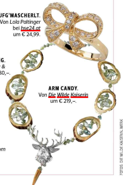
ARM CANDY. Von Die Wilde Kaiserin um € 219,-.