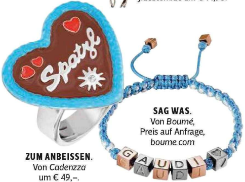
SAG WAS. Von Boumé, Preis auf Anfrage, boume.com