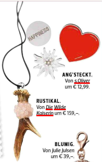
ANG'STECKT. Von s.Oliver um € 12,99.