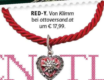
RED-Y. Von Klimm bei ottoversand.at um € 17,99.