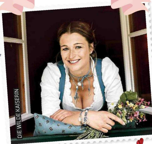
DIE WILDE KAISERIN