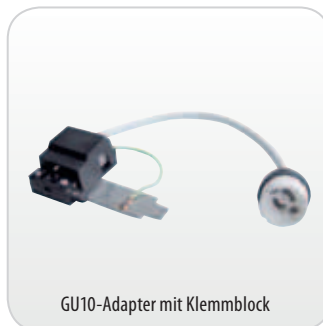
GU10-Adapter mit Klemmblock